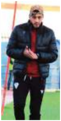
قام مهاجم مولودية وهران بن حمو باللقطة لا رياضية على الإطلاق تجاه الحمرارة الذين سجلوا حضورهم بتدرجات ملعب العالية، حيث وفي

الوقت الذي كان فيه مهاجم شباب بلوزداد سابقا يغادر أرضية الميدان بعد تغيير أحنه المدرب بلعطوي، أشار لأنصار المولودية في المدرجات ثم قام بلقطة غير أخلاقية أغضبته كثيرا الحمرارة وحتى أنصار الفريق المحلي إتحد بسكرة.