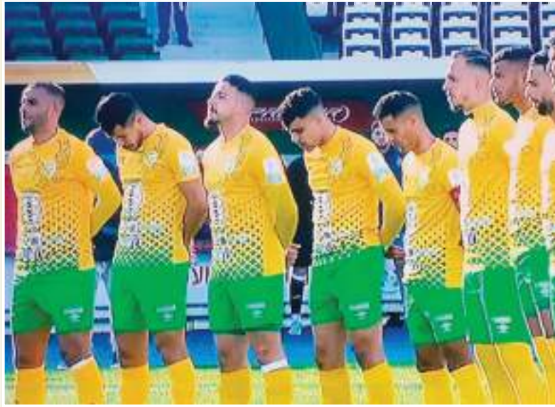
مرتبة خامسة بـ 42 نقطة حصيلة "النسور" النهائية

الحصيلة "النهائية ل" النسور" كان بالإمكان أن تكون أحسن، لولا النقاط الكثيرة التي ضيعها الفريق في ملعب 20 أوت ببشار، خصوصا في الجولات الأخيرة، والتي كانت تجعله يتنافس حتى على إنهاء البطولة في المركز الثاني وليس "البوديوم" ولكن عوامل عديدة لم تخدم الفريق، خصوصا الإصابات، والبرمجة الكارثية التي أتعبت كثيرا اللاعبين، وجعلتهم يهترون في الجولات الأخيرة، ويضيعون هدف "البوديوم" في نهاية المطاف.