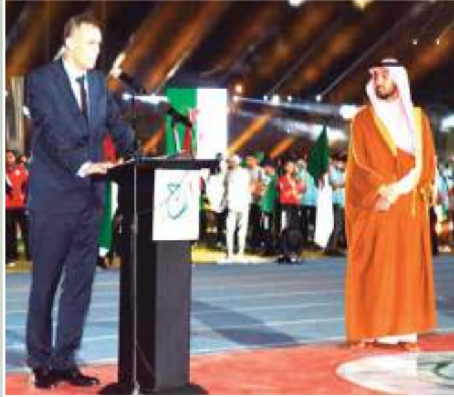
الشعب الجزائري الرائع، كل في مكانه كبيراً وصغيراً، شعباً وجمهورية ومسؤولاً ورياضياً في

وتصدرت الجزائر المركز الأول في جدول الميداليات بحصولها على 255 ميدالية: 106 ذهب، 77 فضة، 72 برونزية. وتنافس الرياضيون خلال هذه النظاهرة الرياضية الدولية في 24 اختصاصا مسجلا في البرنامج العام للألعاب من بينها ثلاث رياضات استعراضية. إضافة إلى الجزائر، شاركت في الألعاب الرياضية العربية 2023 كل من: الأردن، الإمارات العربية، العربية السعودية، السودان، العراق، المغرب، تونس، مصر، اليمن، تونس، سوريا، فلسطين، قطر، الكويت، البحرين، عمان، ليبيا، جزر القمر، جيبوتي، وموريتانيا.