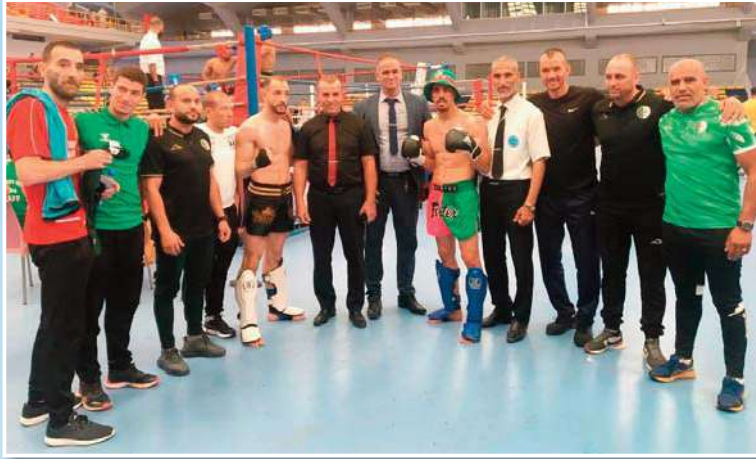
فئتي الأواسط والأكابر . حيث كانت الاشارة والروح الرياضية حاضرة بقوة في جميع النزالات