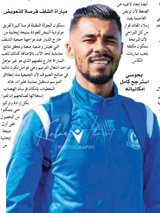
بحوصي استرجع كامل إمكانياته

ستكون الجولة المقبلة فرصة كبيرة لفريق مولودية البيض للعودة بنتيجة إيجابية من خارج الديار عند مواجهة جمعية الشلف التي تعيش وضعية صعبة وتحقق نتائج متذبذبة لحد الآن، بالإضافة لذلك للعب المباراة خارج ملعبهم الذي هو غير موهل لتواجد أشبال الترميم وهي عوامل تكون دائما في صالح الضيوف لأن الجمعية منذ إنطلاق الموسم تستقبل بمدينة غليزان، هاته المعطيات بإمكان فرسان الهضاب إستغلالها لصالحهم إن لعبوا بكل إرادة وتركيز حتى يتمكنوا من الحصول على أول نتيجة إيجابية من