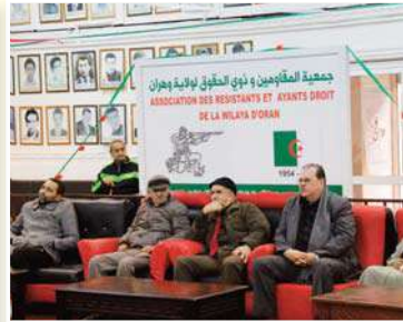
عن مشاهدة مظاهرات 11 ديسمبر 1960.

إطارات مديرية المجاهدين وذوي الحقوق وممثل المجتمع المدني وكذا إطارات مديرية الشؤون الدينية. قام المشاركون في هذه الذكرى بوضع إكليل من الزهور، والاستماع للشهيد الوطني، وتلاوة فاتحة الكتاب ترحما على أرواح الشهداء الأبرار. لتواصل النظرة الخاصة بالذكرى، التي أقيمت بعقر جمعية المقاومين وذوي الحقوق، بالتنسيق مع مديرية المجاهدين وذوي الحقوق والأمانة الولائية للمنظمة الوطنية للمجاهدين والأمانة الولائية لمنظمة الوطنية لأبناء المجاهدين لولاية وهران. كما تم تنظيم ندوة تاريخية نشطة عدد من أبناء المجاهدين الذين كانوا شهداء عيان