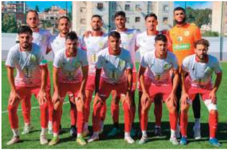
شبيبة القبائل يبقى مهم جدا بالنسبة لـ «نور الجنوب» أيضا ، من أجل إسترجاع ثقة أنصارهم الأوفياء وكذلك هيبة ملعب 20 داخل الديار في الجولة ما قبل الماضية أمام إتحاد خنشلة، وهو ما يتطلب مجهودا مضاعفا من