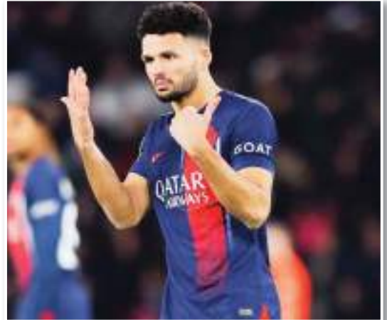
كشفت صحيفة ريكورد البرتغالية عن سر ابتعاد مهاجم جوتزالو راموس عن التواجد مع فريق باريس سان جيرمان بشكل معتاد مؤخراً، حيث أصيب اللاعب بعدوى فيروسية خطيرة

وكان اللاعب قد شارك في مباراة باريس سان جيرمان ضد ميتز في 20 ديسمبر وهي التي فاز بها الفريق العاصمي بثلاثة أهداف لهدف، ودخل راموس إلى المستشفى بعدها، خلال عطلة أعياد الميلاد التي قضها في البرتغال حيث تدهورت حالته. وكان راموس قد عاد للمشاركة أساسياً ضد ريفيل في كأس فرنسا في 7 يناير، في مباراة الفوز بستة أهداف نظيفة، ولم يكن في أفضل حالاته بعد ولكنه قد شفي عملياً الآن وسيكون أيضاً على وشك الاستعادة وزنه المفقود.