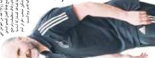
بلماضي يركز على الجانب النفسي

يهدف المدرب الجديد، الذي قادّه المدرب الجديد، هوّز في مباراة ضدّ ليبيا، هذا التّصنيف الذي اعتبره «ممتازاً». أمام الفرق الـ 11، ضمن المجموعة الأولى، في مباراة ضدّ ليبيا، هذا التّصنيف الذي اعتبره «ممتازاً».