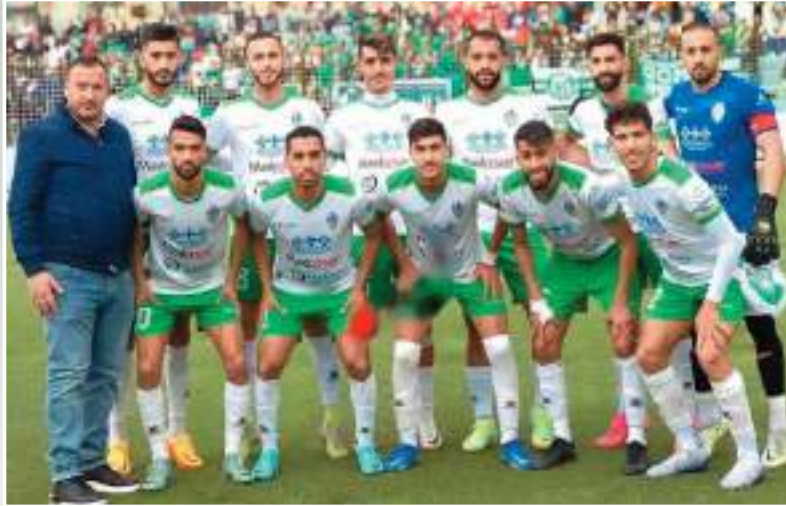
لدمع أشبال بن شوية من أجل العودة باللقاظ سانداو اللاعبين بقوة وكانوا اللاعب رقم 12 بالفريق ويبقى حلمهم هو تحقيق الصعود إلى القسم الأول . بانمياز . ليوكندا مرة أخرى وقوفهم الدائم مع الثلاثة من هناك . حيث تنقل حوالي 500 مناصر

سيستأنف لاعبي غالي معسكر التدريبات صبيحة اليوم في ملعب مفلح عواد بعد أن استفاد زملاء حماس من يوم راحة بعد لقاء بوفاريك . حيث ستكون العنوبات في السماء بعد تحقيق ثلاث نقاط ثمينة من خارج الديار . ووفاء الإحارة بوعودها بتسديد منح الفوز مباشرة . وهذا ما سيسجل أبناء بن شوية في أمم الجهزية للمباراة القادمة داخل القواعد .