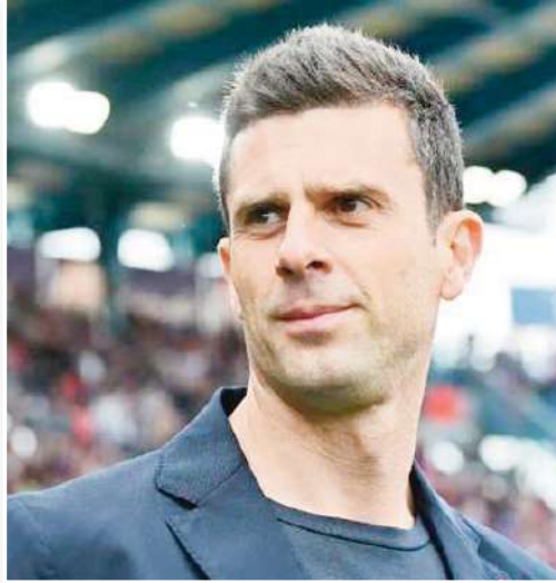
ويحتل يوفنتوس حالياً المركز الخامس في جدول ترتيب الدوري الإيطالي برصيد 52، ويسعى ترتيب يوفنتوس مركز مؤهل لدوري أبطال أوروبا الموسم المقبل على الأقل.

رفض المدرب الإيطالي تياجو موتا، مدرب يوفنتوس، الحديث عن الاستقالة بعد الخسارة أمام فيورنتينا بنتيجة 0-3 في الدوري الإيطالي. وسجل ثلاثية الفيولا على أرض ملعب أرتيميو فرانكي كل من روبن جوسينس وروناندو ماندراجورا وألبرت جودموذندسون.