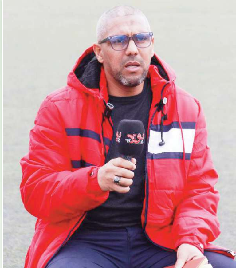
«السهير من أكبر الأخطاء التي يقع فيها الرياضيون خلال رمضان، لأنه يؤثر على

«رسالتي للجميع هي نشر أخية، التسامح، والتآخي، وأن نكون بدأً واحدة من أجل الوطن. كما لا ننسى أن ندعو لإخواننا في غزة، وأن نكون دانساً في صف الخير والسلام. أشكر جريدة "بولسا" على هذه الاستضافة، وأتمنى لها المزيد من النجاح».