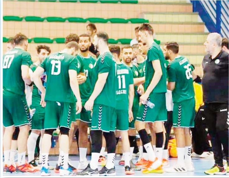
كان لهم رأي مغاير و خطفوا بطاقة العبور إلى المباراة المؤهلة لبطولة العالم. السابفة ضد المنتخب الأنغولي الذي كان مرشحا للفوز لكن أشبال المدرب كيفن ديكو

سيكون المنتخب الوطني الجزائري لكرة اليد اليوم على موعد مع مباراة فاصلة مؤهلة للبطولة العالمية التي ستلعب في السويد و بولندا، حيث سيواجه منتخب غينيا في مباراة تحديد صاحب المركز الخامس المؤهل مباشرة إلى بطولة العالم، في لقاء سيلعب بداية من الساعة الثانية زوالا بتوقيت الجزائر بقاعة الدكتور حسن مصطفى بالعاصمة المصرية القاهرة، أشبال رابع غربي لا يبدل لهم سوى تحقيق الفوز و ترك كل المشاكل التي تعاني منها كرة اليد الجزائرية جانبا من أجل إنقاذ ما يمكن إنقاذه و الحفاظ على سمعة هذه الرياضة، هذه المواجهة ستكون صعبة للغاية أمام منتخب غينيا الذي حقق مفاجآت كبيرة خلال هذه الدورة بداية بالفوز على الخضر في أول مباراة دوري المجموعات و التأهل للدور الربع نهائي في صدارة المجموعة، كما فاز المنتخب الغيني المدجج باللاعبين المحترفين في الدوري الفرنسي في المباراة