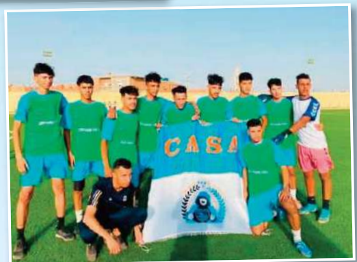
بروز عديد المواهب خلال الدورة

آخر مباراة. شهدت دورة مقطع دوز في طبعها الثانية تنافسية وندية كبيرة بين مختلف الفرق حيث عرفت مستوى متزايد مع مرور الجولات أين أستمع الجميع بالمستوى الفني الكبير والمباريات الشيقة التي غلب عليها طابع الحماس والتشويق نظير مشاركة لاعبين ممتازين امتعوا الجمهور الى جانب بروز عدة مواهب استطاعت صنع الحدث ما اعتبر فرصة لحضور مناخرة وكشافين لثابعتها عن كتب.