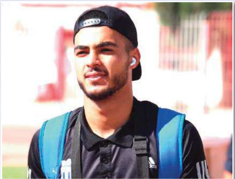
الموسم القادم في هذا الحوار.

«أنا ألعب الآن من أجل المحافظة على لياقتي بواسطة المشاركة في بعض الدورات الصيفية هنا بمدينة الوادي حتى أجيد نفسي جاهزاً عند بداية العمل والتدريبات تأهباً للموسم الكروي المقبل ، رغم أنني لم أحدد الوجهة بعد والوقت