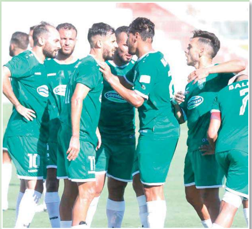
رغم دخول النصف الثاني من شهر جويلية و اقتراب موعد شروع الأندية في التحضير بالغموض داخل بيت جمعية وهران، و الصورة ليست واضحة تماما بشأن مستقبل النادي، فالأنصار لا يزالون مصرين على إحداث تغيير

وما هو واضح و مؤكد هو أن الإدارة الحالية تريد كسب المزيد من الوقت و الذي سيكون في صالحها، لأن مرور الأيام دون عقد الجمعية العامة سيجعل حظوظها في البقاء على رأس الفريق و تسييره لموسم آخر كبيرة جدا، كما أن