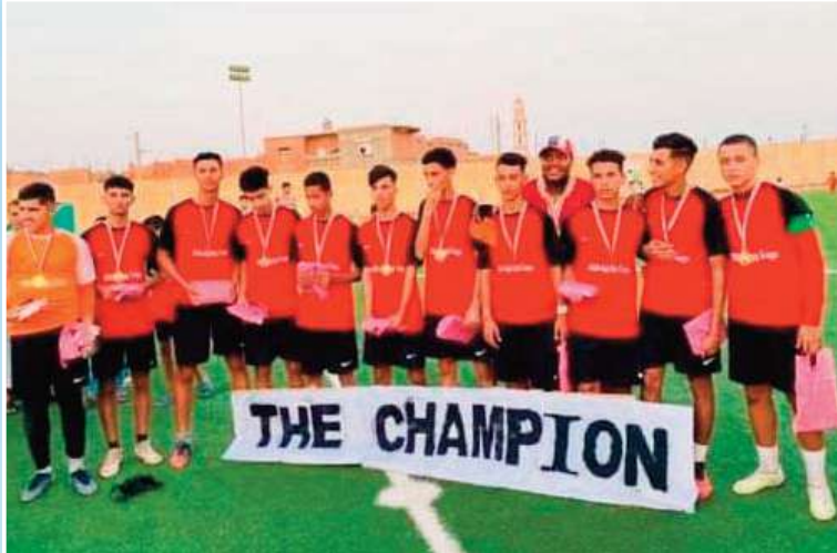
عبد المومن حيث كانت المباراة الاروع و الاجمل و الامتع في الدورة فقد كان الكل في