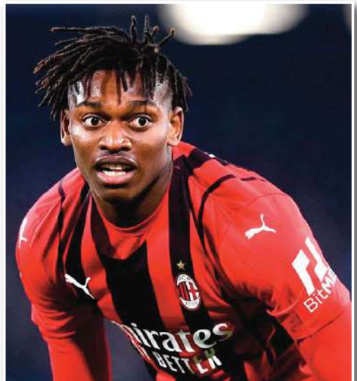
يتمسك ميلان باستمرار نجم الفريق البرتغالي رافائيل لياو، ويعمل على تجديد عقده خلال الفترة القريبة المقبلة. ويتبني عقد لياو (23 عاماً) مع ميلان، بنهاية الموسم المقبل، وسط اهتمام من قبل عملاقة البريميرليغ، وتحديداً مانشستر سيتي وتشيلسي. وكشف فابريزيو رومانو، خبير سوق الانتقالات في أوروبا، تفاصيل جديدة بشأن محاولات ميلان لتجديد عقد لياو. وقال رومانو: "يسعى ميلان لحسم ملف تجديد عقد لياو والانتباه منه في أقرب وقت ممكن". وأضاف: "من المتوقع إجراء جولة جديدة من المحادثات في الأيام المقبلة مع محامي اللاعب في ميلانو". وختم: "عرض ميلان أكثر من 7 مليون يورو صفائي راتب في الموسم، بخلاف المكافآت". وشارك لياو في 30 مباراة مع ميلان هذا الموسم، في جميع المسابقات، وتمكن من تسجيل 9 أهداف وصناعة 10 أخرى.