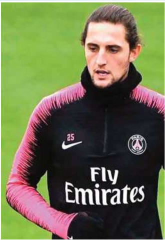
كشف تقرير صحفي إيطالي، يوم الأربعاء، آخر التطورات بشأن مستقبل الفرنسي أديريان رايو، لاعب وسط يوفنتوس. ويتبني تعاقد رايو في تورينو، بنهاية الموسم الجاري، ولم يتم الاتفاق حول التجديد حتى الآن. ويسعى يوفنتوس جدياً للحفاظ على رايو، بعدما استعاد حظه كثيراً جداً من مستواه، وكان مؤثراً مع منتخب بلاده فرنسا في مونديال قطر. وبحسب موقع "كالتشيو ميركاتو" الإيطالي، فقد تواجداً والدة أديريان رايو وكيله فيرنو نيك، في ملعب تدريبات يوفنتوس، الثلاثاء، لمناقشة تجديد عقده. وأضاف التقرير، أن رايو لم يستبعد إمكانية البقاء في يوفنتوس وتجديد عقده، لكنه طلب الحصول على 10 مليون يورو في الموسم الواحد. وحاولت أندية آرسنال ومانشستر يونايتد، جس نبض رايو، حول الانتقال للعب في البريميرليغ، لكنه اشترط الحصول على نفس الرقعة، وهو ما رفضه الناديان. ويتقاضى رايو حالياً 7 ملايين يورو في الموسم، بالإضافة إلى المكافآت المتعلقة بالأداء، ومن المحتمل أن يعرض يوفنتوس على اللاعب التجديد بنفس الشروط المالية دون زيادة.