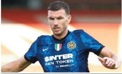
شدد البوسني إيلدين دجيكو، نجم إنتر ميلان، على أهمية مواجهة المديرين أمام ميلان في كأس السوبر الإيطالي غدا بالرياض، كاشفاً رأيه في الدوري