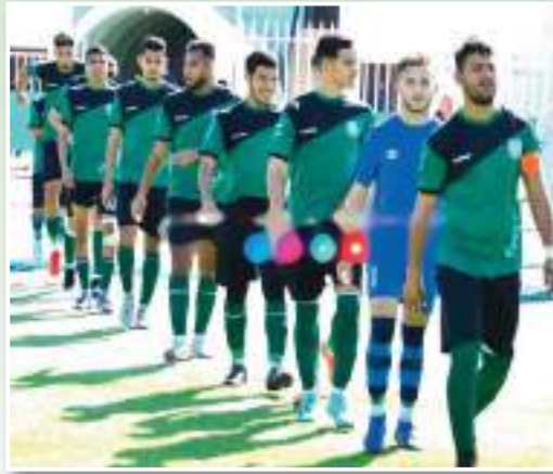
تحدى الظروف وعاد بنقطة مفيدة للمعنويات

البارز في أداء تشكيلة السريع الغليزاني خلال