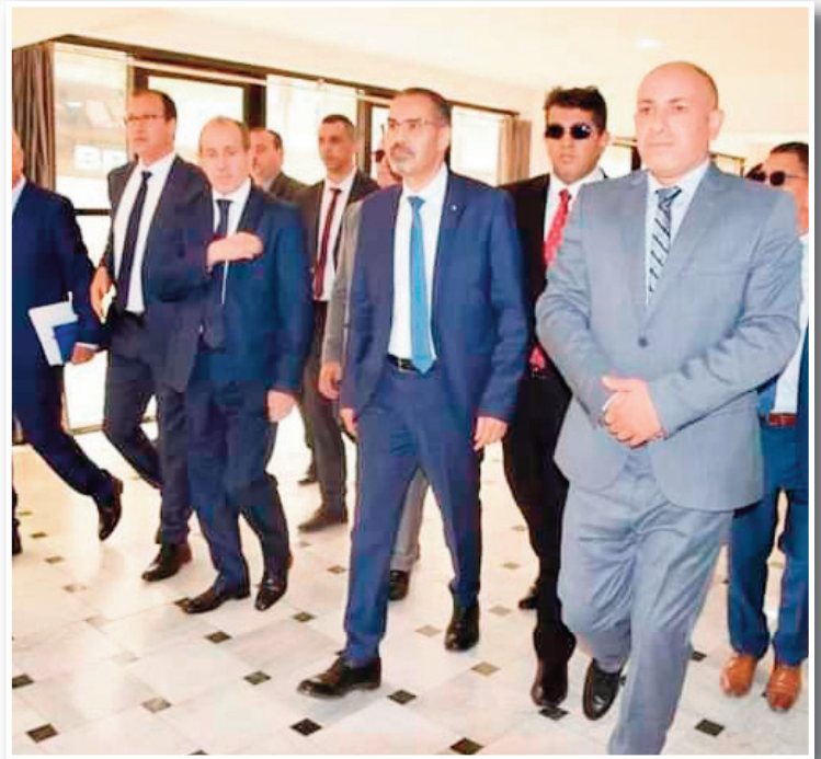
شدد وزير الشباب والرياضة عبد الرزاق سيقاق أول أمس بعناية على ضرورة تسريع وتيرة إنجاز أشغال تهيئة وتأهيل المنشآت الرياضية التي ستحتضن المنافسة الكروية القارية "شان 2023" و "عبد القادر شابو" بمدينة عنابة المعينين باستضافة المزمعة بالجزائر وإطلاق مختلف أشغال وأعمال معابته لورشات إنجاز أشغال تهيئة وتأهيل ملعب "19 ماي 1956" و "عبد القادر شابو" بمدينة عنابة المعينين باستضافة

جزء من منافسات كأس أم إفريقيا للاعبين الخليلين لكرة القدم "شان 2023"، أوضح الوزير الذي قام بزيارة عمل وتفقد للولاية بأن "تحضير المنشآت الرياضية في الآجال المحددة يمثل التزاماً قوياً من السلطات العمومية التي توفر الإمكانيات الضرورية لذلك"، مؤكداً على "ضرورة العمل في الاتجاه الذي يضمن احترام هذا الالتزام". وشدد الوزير في هذا السياق على "ضرورة إطلاق مختلف حصص الأشغال المبرمجة بالتوازي بملعب 19 ماي 1956 وعبد القادر شابو"، موضحاً بأن حصص الأشغال المرتبطة بالأرضية والإنارة والمدرجات تعد "محورية فيما يتعلق بتقدم الأشغال ويتعين الإسراع في إطلاق أشغالها". وخلال تفقده للأشغال الجارية لتوسيع هياكل ملعب 19 ماي 1956 الخاصة بالفرق ووسائل الإعلام وكذا استحداث ملحقات للخدمات وتركيب الكراسي بمدرجات هذا الملعب الذي يتسع لـ 52 ألف متفرج، أكد السيد سيقاق على "أهمية احترام نوعية الإنجاز والمقاييس المحددة من طرف الهيئات الكروية الدولية"، مشيراً إلى منح الأفضلية للمنتوج الوطني الذي يتجاوب مع المقاييس المحددة. كما زار الوزير في إطار إعادة تأهيل المنشآت الرياضية المتوفرة واستغلالها لخدمة الرياضة وأبناء المنطقة كل من موقع طاباكوب بمدينة عنابة الذي يتوفر على مساح