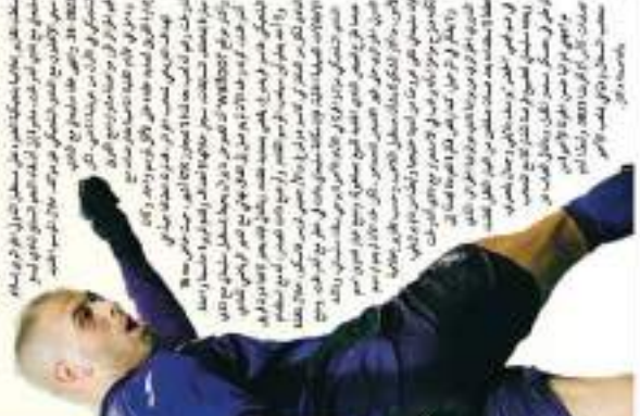
سليمان يبتاع مع أندريخت لتمديد عقده موسم واحد.