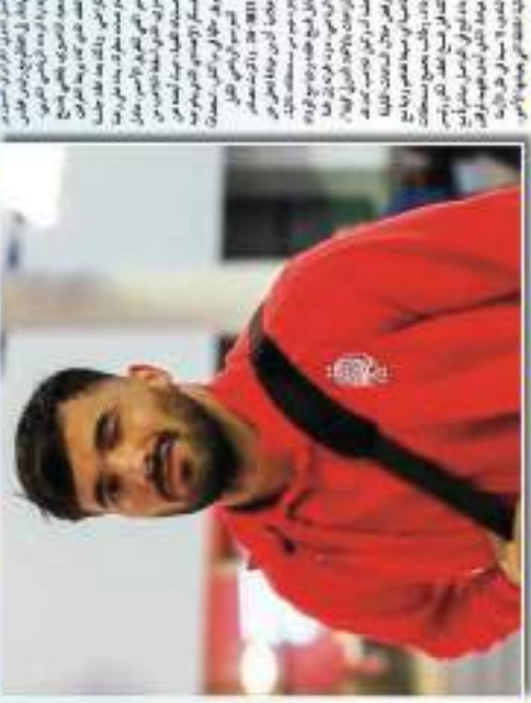
مع الوداد البيضاء يفسخ عقده.