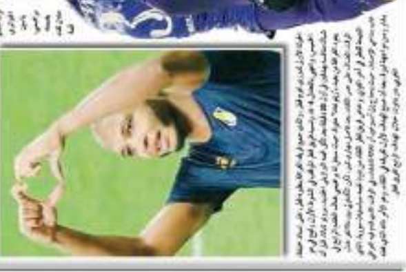
براهيمي يتألق في افتتاح الدوري القطري.