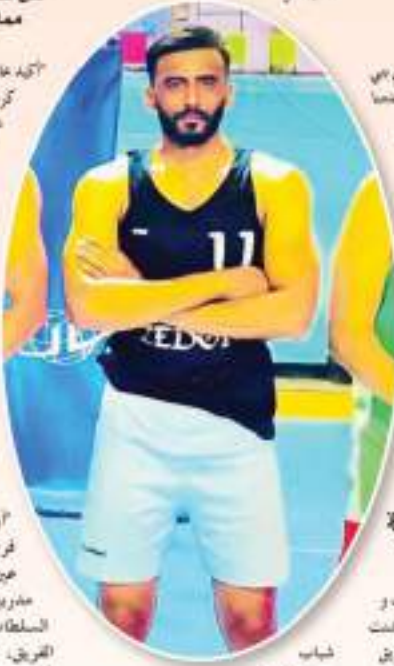
شباب عين تموشنت

"أرد أن أشكر كل من أعطاني فرصة للعب في فريق شباب عين تموشنت من مسوئين ومدربين. ومن هذا الخبر أناشد السلطات المحلية بالإلتفاف حول الفريق، و تقديم له الدعم اللادبي و المعنوي. فكرة السلة في الولاية لها تاريخ فواجب المحافظة عليه و بناء ملاعب جوارية خاصة بكرة السلة."