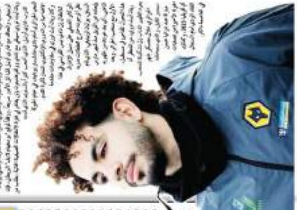
أيت نوري يلقى التثناء من مدرب ووضعه في القائمة.