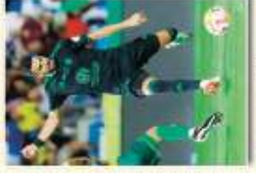
أحمد محرز يسجل أول أهدافه في الدوري السعودي مع فريقه الجديد.