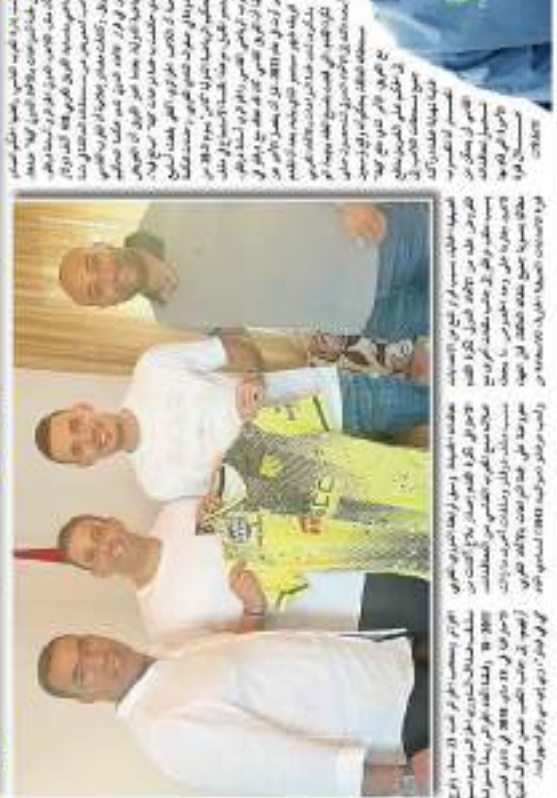
درفلو في نزاع قضائي مع المغرب الفاسي.

النادي الفاسي يفسخ عقده مع اللاعب. هذا القرار يأتي بعد فترة طويلة من المفاوضات التي فشلت في التوصل إلى اتفاق جديد. اللاعب، الذي كان قد انضم إلى النادي في وقت سابق، لم يتمكن من إثبات قيمته في الملعب كما كان متوقفاً. هذا القرار يعكس سياسة النادي في تجديد صفوفه باللاعبين الذين يمكنهم المساهمة في تحقيق الأهداف.