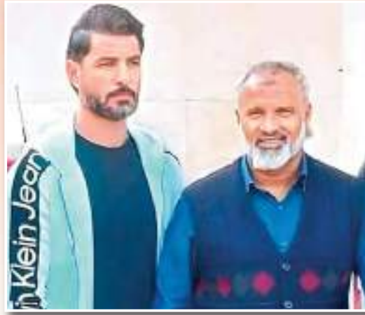
معلومات من مصادرها الخاصة فإن عدة أطراف ومساهمين ولاعبين قدامى وحتى أنصار، راسلوا خلال الساعات القليلة الماضية أحد