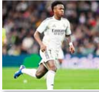
أي إشارة للاستسلام.

حدث. ومع ذلك، تظل الرؤية واضحة لدى إدارة الملكي بشأن قيمة اللاعب وضرورة تجديد عقده الذي ينتهي في جوان 2027، مع الالتزام الصارم بسلم الرواتب المحدد من قبل النادي. لقد خاض فينيوس 351 مباراة بقميص المريخي، وسعى قادة النادي لتجديد هذه المسيرة إلى ما بعد صيف 2027.