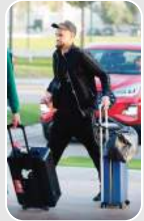
المدرّب بيتكوفيتش مستقبلاً.

التحق آدم زرقان متوسم ميدان نادي شارل لوروا البلجيكي بتريص المنتخب الوطني في مركز تحضير المنتخب الوطنية في سيدي موسى، ومن المرجح أن يكون الناحب الوطني قد استعان بزرقان بسبب شكوك حول جاهزية بعض اللاعبين وهو ما كشفه خلال الندوة الصحفية، و يبدو أن لاعب بارادو السابق يدخل في مخططات