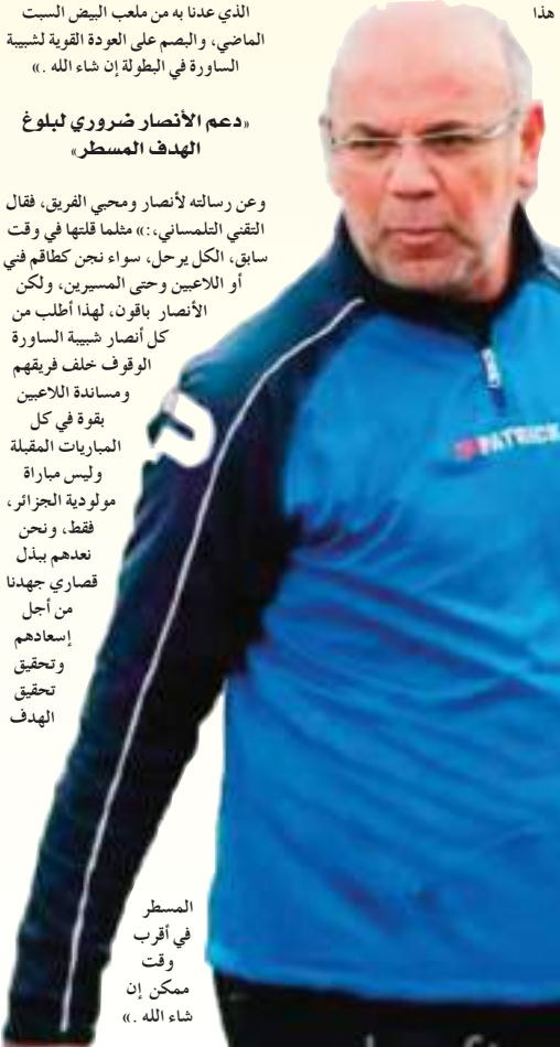
المسطر في أقرب وقت ممكن إن شاء الله. «

وعن رسالته لأنصار ومحبي الفريق، فقال التقني التلمساني: «متلما قلتهما في وقت سابق، الكل يرحل، سواء نحن كطاقم فني أو اللاعبين وحتى المسيرين، ولكن الأنصار باقون، لهذا أطلب من كل أنصار شبيبة الساورة الوقوف خلف فريقهم ومساندة اللاعبين بقوة في كل المباريات المقبلة وليس مباراة مولودية الجزائر، فقط، ونحن نعدكم ببدل قصاري جهدنا من أجل إيساعدهم وتحقيق تحقيق الهدف