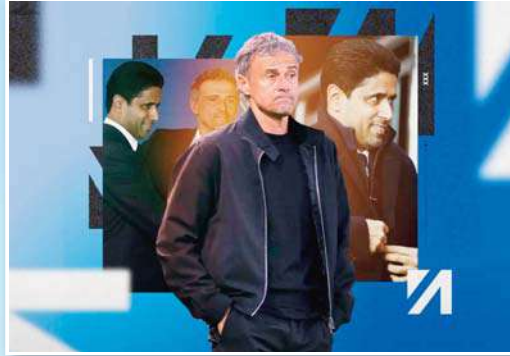
عدائية أمراً لا مفر منه.