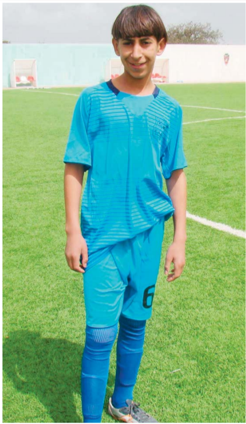
"أشكر كثيرا جريدة بولا على هذه الالتفاتة المميزة وبالتوفيق لهذا المنبر الإعلامي في مهمته النبيلة ليبقى في خدمة الرياضة بصفة عامة".

"بالطبع أحسن هدف سجلته كان رائعا ومميزا بشهادة الحضور والمدرّب كذلك، عن طريق تنفيذ مخالفة مباشرة من على بعد 20م حينها كنت ضمن الأولمبي".