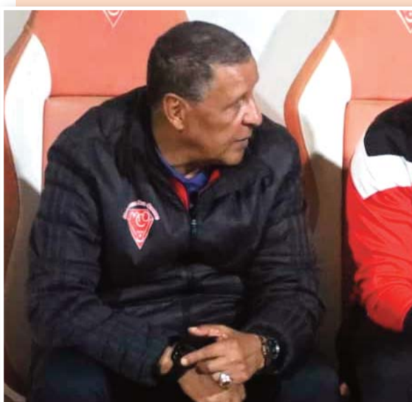
الشديدة التي طالته في مبارتي المدية والنصرية.