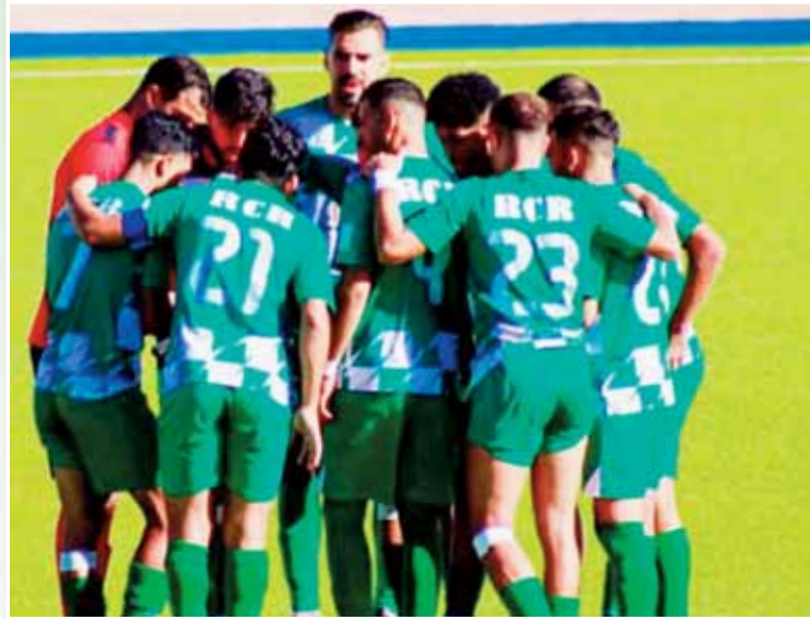
استغل اتحاد سيدي أحمد بن علي "رؤ" هذه الجولة أفضل استغلال حيث عاد بفوز ثمين من على تحقيق الصعود مستفيدا في الوقت ذاته من

تعثر سريع غليزان واتحاد بلعباس ما سمح له بتوسيع الفارق إلى خمس نقاط كاملة قبل ثلاث جولات فقط عن نهاية الموسم وهو فارق يبدو مريحا جدا ويقرب الفريق بنسبة كبيرة من تحقيق الهدف المنشود، كما لم يكن حال اتحاد بلعباس أفضل من الرايد بعدما فشل في تحقيق الفوز أمام بن داود و اكتفى بالتعادل السلبي في مباراة لم ترق إلى تطلعات أنصاره، حيث فقد الفريق للفعالية الهجومية والمسة الأخيرة ليضع بدوره فرصة تقليص الفارق مع المتصدر و يعقد مهمته في سياق الصعود خاصة في ظل اشتداد المنافسة و ضيق هامش الخطأ في الجولات الأخيرة.