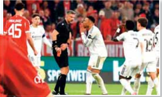
باريس سان جيرمان.

يواجه بايرن ميونخ خطر عقوبات محتملة، بعدما فتح الاتحاد الأوروبي لكرة القدم (يويفا) تحقيقاً بسبب تصرفات جماهيره، خلال مباراته الأخيرة ضد ريال مدريد، في إياب ربع نهائي دوري أبطال أوروبا. وتغلب العملاق البافاري على ضيفه المردي (3-4)، الأربعة الماضي على ملعب أليانز آرنا في ميونخ، ليحسم تأهله إلى نصف النهائي بمجموع المبارتين (6-4). وعندما أحرز مايكل أوليسيه هدف بايرن ميونخ الرابع، قبل صافرة النهاية، اقتحم بعض المشجعين محيط الملعب واندفعوا نحو المصورين، ما تسبب في إصابات بين المتواجدين. كما شارك جمال موسيلا، نجم الفريق الألماني، في الاحتفال داخل الزحام، ما أدى إلى محاصرة بعض الصحفيين بين الحشود. ولا يزال من غير الواضح، حتى الآن، ما إذا كان بايرن ميونخ سيعاقب بحرمان جماهيره من الحضور، خصوصاً في مباراة إياب نصف النهائي ضد