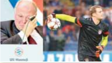
تحدث أولي هونيس، الرئيس الشرقي لبايرن ميونخ، عن رؤيته لمستقبل حراسة المرمى في النادي البافاري.

الإرشادي.. بالناسية، هو يتفاهم معه جيدا جدا، أما مع نوبل، فكان الأمر مختلفا قليلا؛ لذلك نأمل أن يبقى عامداً آخر، ويساعد في إعداد مستقبل هذا المركز». وانتقل هونيس للحديث عن الهوية الوطنية داخل الأندية، مشيراً إلى «مشكلة ليفربول» الحالية. «بالنسبة لمسألة الألمان والأجانب، لا يهمني إن كان اللاعب أسود أو أبيض أو أي شيء آخر، لا يمكن أن تلعب بفرق كله من جنسية واحدة.. بايرن ميونخ دائماً ضد العنصرية، وليس لدينا مشكلة في هذا الجانب.. لكن يجب أن يكون لديك لاعبون نشأوا في ألمانيا، وربما من بافاريا، لأن ارتباطهم بالنادي يكون مختلفاً عن لاعب يأتي ثلاث سنوات ثم يرحل». وتابع: «يجب الحذر، وهذا ما اعتقد أنه المشكلة الحالية في ليفربول.. يجب عدم السماح بنمو عقلية (المرتفعة)، إيفانغ 500 مليون لا يعني بالضرورة أنك اشترت نظاماً أو انسجاماً». وأردف: «ليفربول يجب أن يسأل نفسه الآن ماذا فعلنا؟ اشترنا إيزاك مقابل 150 مليوناً من نيوكاسل، وبعوا (لويس) دياز بحوالي 70 مليوناً فقط، وعليهم اليوم أن يندموا عندما يرون مستواه.. دياز ليس فقط لاعباً جيداً وهدافاً، بل لاعب مجتهد بشكل مذهل، لا يترك شيئاً في جهته.. يعود للخلف ويساعد دفاعياً».