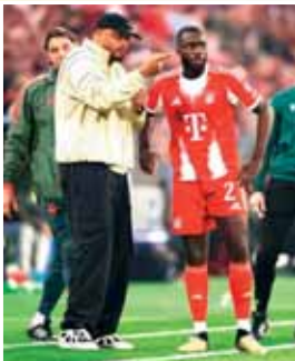
أبدي فينستد كومباني، مدرب بايرن ميونخ، استياءه الشديد من البطاقة الصفراء التي حصل عليها خلال مواجهة ريال مدريد، مؤكداً أنها لم تكن مستحقة. كومباني أوضح أنه التزام الهدوء على الخط، لكنه تدخل فقط للاحتجاج بعد سقوط لاعبه جوسيب ستانيشيتش، ليتفاجأ بإشهار البطاقة التي ستجرمه من التواجد على دكة البدلاء في مواجهة باريس سان جيرمان بنصف نهائي دوري الأبطال.

من جانبه، عبر المدير الرياضي للنادي ماكس إيزل عن دهشته من القرار، مشيراً إلى أن الفريق أبلغ بعدم وجود موقفين، قبل أن يتبين لاحقاً غياب المدرب. ورغم الجدل، شدد مسؤولو بايرن على أن الإيقاف لن يؤثر على طموحات الفريق، مؤكداً أن كومباني سيجد الحلول المناسبة لمواجهة التحدي الأوروبي المرتقب.