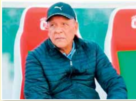
لاعبينا المتعودين على التدريب في مثل هذه الأجواء وهذا التوقيت.

وعن كيفية تعامله مع الغيابات والإصابات العديدة التي ضربت التعداد في الفترة الأخيرة فقال: «هناك لاعبين لعبوا مواجهة خشنلة، تحت تأثير الإصابة، ورغم ذلك أدؤ ما عليهم، وساعدونا كثيرا من أجل تحقيق الفوز، وهو أود