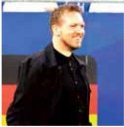
د يوليان ناغلسمان، المدير الفني للمنتخب الألماني، على الانتقادات التي وجهها إليه أوبي هونيس، الرئيس الفخري لنادي بايرن ميونخ، بخصوص عدم

القيات على تشكيلة واحدة. وقال ناغلسمان، في تصريحات عبر قناة «ZDF» الألمانية: «أنا أقدر أوبي كثيرا، والنجاحات المنهلة التي حققها مع بايرن ميونخ، بالطبع لم يكن وحده، لكنه ساهم بشكل كبير في أوروبا». وأضاف: «وأنا أعلم أيضا أنه يملك رقم هاتفي، ويسعدني دائما إذا كان لديه أمر مهم جدًا يريد التحدث معي بشأنه - سواء بخصوصي أو بخصوص الفريق أو المنتخب - فإمكانته دائما الاتصال بي». وتابع مدرب بايرن ميونخ السابق مستشهدا بأحد المواقف: «لكن حدثت أشياء كثيرة، سأعطي مثلا واحدا فقط: أعتقد أنه في سبتمبر شارك أليكس بافلوفيتش، ثم أصيب في أكتوبر... لا أعلم إن كان أوبي سيسهر بالحماوس لو أنني قلت للاعب: «هايا يا بافلو، الإصابة لا تهم، يجب أن تلعب رغم ذلك في أكتوبر». وأردف ناغلسمان: «لكن أوبي يمكنه دائما أن يقول لي ما يريد».