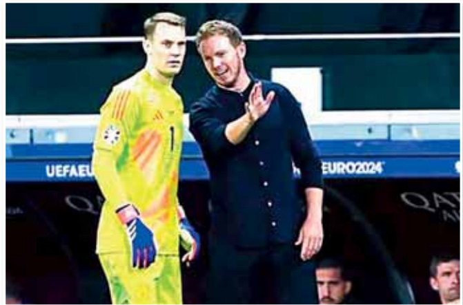
تلقى الجهاز الفني لمنتخب ألمانيا، بقيادة جوليان ناغلسمان، نبأ صادما قبل إعلان القائمة النهائية للفريق، استعدادا للمشاركة في كأس العالم بأمريكا وكندا والسكيبك. وأكدت تقارير ألمانية، في الساعات الماضية، أن حارس بايرن ميونخ