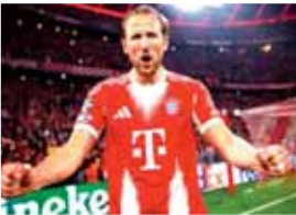
أصبح هاري كين أول لاعب من الدوريات الخمسة الكبرى في أوروبا يسجل 58 هدفا في

موسم واحد منذ أن حقق لويس سواريز هذا الإنجاز مع برشلونة في موسم 2015/16. وحقق مهاجم بايرن ميونخ هذا الإنجاز بعد تسجيله ثلاثية في فوز بايرن 5-1 على كولن في اليوم الأخير من موسم الدوري الألماني. وسجل سواريز 59 هدفا في جميع المسابقات خلال موسم برشلونة 2015/16، مما يعني أن كين كان على بعد هدف واحد فقط من معادلة رصيد اللاعب الأوروغواياني. يشمل إجمالي أهداف كين الراجعة 36 هدفا في الدوري الألماني، و14 هدفا في دوري أبطال أوروبا، وثمانية أهداف في مسابقات الكأس المحلية.