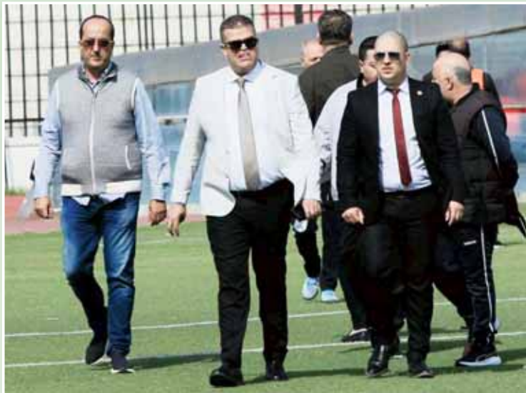
من الأصوات طالبت بضرورة التغيير الجذري، ولهذا فان الإدارة ستكون حتماً

وبناء على هذه المعطيات فان نهاية شهر جويلية سيكون مناسباً من أجل بداية مرحلة التحضيرات الصفيحة، وبعد الكشف عن موعد بداية المنافسة الرسمية فقد بات في حكم المؤكد أن يشرع أبناء المدينة الجديدة في العمل في الأسبوع الأخير من شهر جويلية، إذ تحتاج فترة التحضيرات الصفيحة ما لا يقل عن 40 يوماً حتى يكون اللاعبون جاهزون لخوض المنافسة الرسمية، وكلما كانت بداية التحضير مبكرة فان الطاقم الفني سيتمكن من إيجاد معالم الفريق وكذا الوصول لأفضل جاهزية بدنية ممكنة.