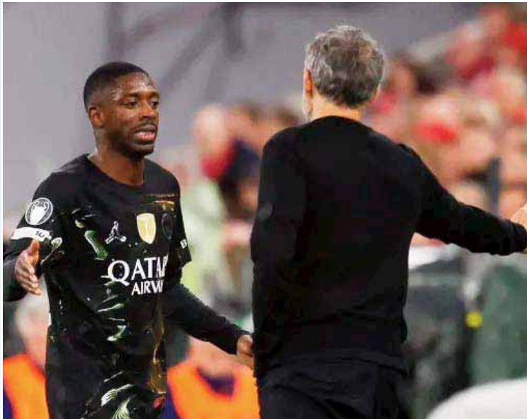
وأضاف بنبرة حادة: "عندما تلعب دون شدة أو طموح، فمن الطبيعي أن يحدث شيء، وهذا ما

وأضاف بإحاط واضح: "اليوم كنا بحاجة إلى أن نكون متحفزين، ولهذا السبب أنا محبط".