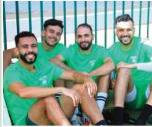
التي قد تستغرق وقتاً طويلاً قبل الوصول.

وفي ظل هذه المعطيات، وإقدام إدارة النادي على تسديد جزء من المستحقات، فان الكرة الآن باتت في مرمى اللاعبين، وهم مطالبون الآن ببذل أقصى ما لديهم من أجل العودة بنتيجة ايجابية خارج الديار في ضيافة شباب عين تموشنت و التأكيد على العودة القوية لأبناء المدينة الجديدة، فلا وجود لأي أعذار لزملاء