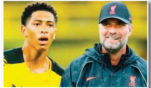
مع الشاب الإنجليزي المميز.

ذكرت شبكة "سكاي سبورتنس" أن نادي ليفربول الإنجليزي لن يتخلى عن حلم التعاقد مع جود بيلينغهام نجم خط وسط بوروسيا دورتموند الألماني. ولفت الدولي الإنجليزي جود بيلينغهام ابن 19 عاماً الأنظار إليه بقرة مع بوروسيا دورتموند، مما دفع كبار أندية أوروبا للسعي وراءه. ويعتبر ريال مدريد الإسباني وليفربول هما أبرز المرشحين للفوز بصفقة جود بيلينغهام، وبالرغم من صعوبة المنافسة مع الميونيخ، إلا أن إدارة الليفر