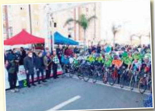
إذن، عدد الرياضيين مهم، أليس كذلك؟

«حالياً، لدينا 22 نادياً، بالإضافة إلى ناديين آخرين من خارج