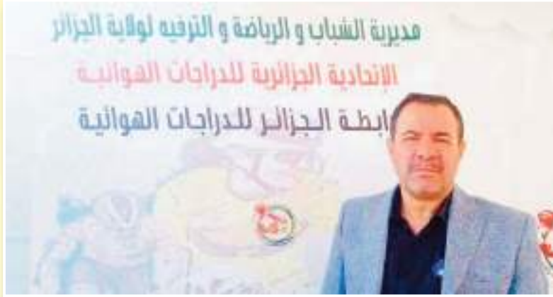
الولايات، قمنا بدمجها معنا، بناءً على طلبهما.»

«بدوري، أقدم لكم تحية كبيرة على كل الاهتمام. أود أن أدعو للاهتمام بهذه