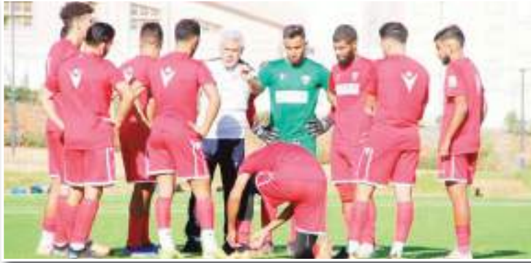
قوة شخصية الفريق عادت لتظهر أمام البيض

بغض النظر عن أهمية نقاط مواجهة مولودية البيض في حسابات الارتفاع عن المنطقة الحمراء وضمان إنهاء البطولة في أفضل مرتبة ممكنة ، يبقى أهم مكسب في هذا الفوز مصالحة الحمراء ، حيث نجح رفقاء المهاجم الهدف مطراني في إعادة الثقة للانتصار في فريقهم ومدى قدرته على الحفاظ على مكانته في الرابطة المحترفة الأولى بأريحية .