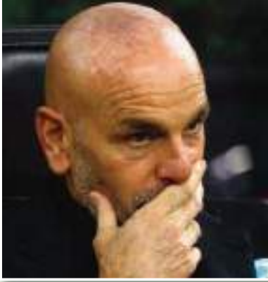
بيولي: «لياو يحتاج إلى الدقة»

أكد ستييفانو بيولي، المدير الفني لفريق ميلان الإيطالي، أن الروسونيري سوف يتعاقد مع مدافع، في شهر يناير الحالي. الروسونيري حل ضيفاً على أودينيزي، مساء أمس، في الجولة 21 من الدوري الإيطالي. وقال بيولي في تصريحات عبر المؤتمر الصحفي قبل اللقاء نقلها موقع «فوتبول إيطاليا»: «قراراتنا لا تتغير، والنادي يعمل على التعاقد مع مدافع».