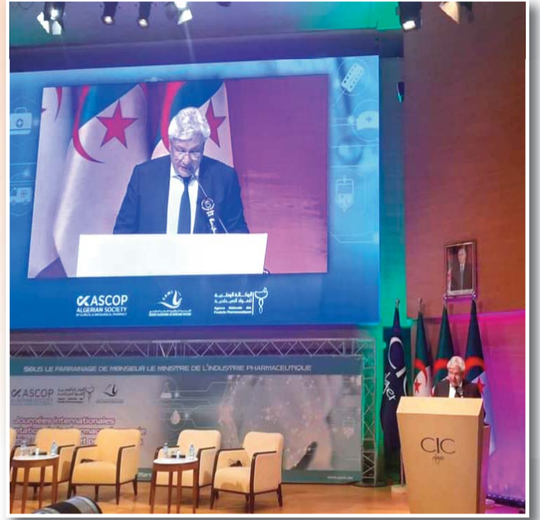
أكد وزير الصناعة الصيدلانية، عبد الرحمان لطفي بن باحمد، ان هناك منتجات من مواد صيدلانية تصل إلى نسبة إدماج بـ 90 بالمائة بفضل عمليات بحث وتطوير محلية. وفي كلمة القاها خلال الطبعه الاولى للأيام الدولية حول تقييم تكنولوجيات الصحة، أوضح بن باحمد أن دائرته الوزارية عملت في هذا الإطار على تحقيق صناعة صيدلانية ذات قيمة مضافة عالية قادرة

على تلبية الاحتياجات الصحية خاصة منها الأدوية المستخدمة في الأمراض المزمنة وكذا العلاجات المتكررة، للمساهمة في رعاية أفضل وتكفل أمثل بالمرضى في بلادنا". كما ذكر الوزير بالنهج التنظيمي الجديد الذي باشرت به وزارة الصناعة الصيدلانية في سياق تحديد أسعار الأدوية المصنعة محليا، حيث تم إدراج، ضمن النصوص التطبيقية، معادلة قائمة على الاقتصاد الصيدلاني، مع الأخذ بعين الاعتبار نسبة الإدماج بإدخال مكونات وأجزاء من أجهزة مصنعة محليا تسمح بالرفع التدريجي في سلسلة القيم وزيادة القيمة المضافة وتصدير المنتجات الصيدلانية الناتجة عنها. ومن أجل الرفع لهذه القيمة المضافة، اعتبر الوزير انه كان مر الضروري ضمان التوازن بين السعر وفائدة المنتجات وكذا التوجه نحو الإنتاج الوطني مع أفضل نمط لتطوير نسبة الإدماج بالمضي نحو البحث والتطوير للمنتجات الصيدلانية بالجزائر. وأبرز انه تم إنشاء مناهج جديدة من خلال التحكم في الأسعار والاقتصاد الصيدلاني "لتمكيننا من زيادة القيمة المضافة ومحاربة ظاهرة تضخم الفواتير، حيث حققنا نتائج معتبرة للعلاية من حيث انخفاض أسعار المنتجات النهائية والمواد الأولية، قائمين دائما على إحداث توازن بين خفض فاتورة الاستيراد وتغطية السوق بإنتاج محلي مع ضمان تكفل أفضل بالمرضى. وفي