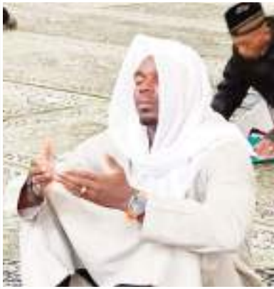
حصل نجم المنتخب الفرنسي لكرة القدم بول بوغبا ملايين الإعجابات بسبب منشوراته الدينية في شهر رمضان المبارك، وآخرها منشور علق فيه على قرار إيقافه لمدة 4 سنوات مما يعني انتهاء مسيرته الكروية. وقضت محكمة مكافحة المنشطات الإيطالية - نهاية

الشهر الماضي - بإيقاف بوغبا (30 عاماً) لاعب وسط يوفنتوس الإيطالي 4 أعوام بسبب تناوله هرمون الستيروستيرون الخطير في أغسطس/آب الماضي، وهي العقوبة القصوى. وفي منشور عبر حسابه على إنستغرام قال اللاعب المسلم بوغبا "لم يسبق أن تعلمت وكبرت بهذا القدر في عام واحد. الاختبارات التي قدرها الله لا مفر منها، ومن السهل النظر إلى الجوانب السنية فقط ولكن مهما يكن.. الحمد لله". وأضاف نجم مانشستر يونايتد السابق "الحمد لله على السراء والضراء والأوقات الصعبة وأوقات اليسر"، وذلك في إشارة واضحة على الإيقاف الطويل. وأخفق بوغبا - الذي غاب عن أغلبية موسم 2022-2023 - واكتفى بخوض 10 مباريات فقط بسبب الإصابات - في فحص المنشطات الذي خضع له بعد المباراة بين يوفنتوس ومضيفه أودينيزي هذا الموسم في الكالتشيوي، والذي لم يشارك فيه منذ 20 أوت الماضي. ورغم أنه بقي على مقاعد البدلاء ولم يشارك في اللقاء، فقد كان أحد الذين تم اختيارهم بشكل عشوائي للخضوع للاختبار. ولتبرير هذه مخالفة أفاد المقربون من اللاعب بأن الستيروستيرون يأتي من مكمل غذائي وصفه طبيب استشاري في الولايات المتحدة. وكان بوغبا أعلن على إنستغرام أنه "سيستأنف" ضد قرار الإيقاف أمام محكمة التحكيم الرياضية (تاس). وتلقى بوغبا دعماً كبيراً من جماهير كرة القدم التي كتبت له أكثر من 50 ألف تعليق إضافة إلى أكثر من مليون إعجاب، وتضاعفت أعداد الإعجابات في بداية شهر رمضان على منشور بسيط كتب فيه "رمضان كريم" مع صورة له في المسجد الحرام، حيث يحرس دائماً على أداء العمرة.