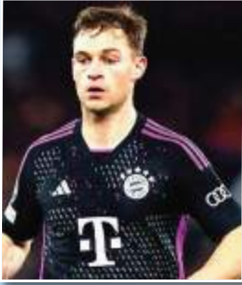
يوافق نادي بايرن ميونخ الألماني على فكرة بيع عقد الألماني جوشوا كيميشت الصيف المقبل، بشرط واحد، حسبما أفادت شبكة سكاى ألمانيا، مساء الإثنين. النادي الالفاري لا يمنع فكرة بيع عقد كيميشت في المراتك الصيفي شريطة الحصول على عرض مالي مناسب، علماً بأن مفاوضات تجديد العقد مع الإدارة الالفارية متوقفة تماماً.