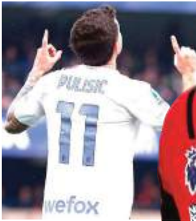
نجم الأمريكي كريستيان بوليسيتش في خطف الأضواء بموسمه

الأول مع ميلان الإيطالي ليجعل تشيلسي الإنجليزي يعرض أصابع الندم على التفريط فيه. وانتقل الدولي الأمريكي ابن 25 عاماً للعب في صفوف ميلان خلال سوق الانتقالات الصيفية الماضية قادماً من تشيلسي بمبلغ 20 مليون يورو. ولم يتجح بوليسيتش بعد انتقاله إلى تشيلسي صيف 2019 في الظهور بالمستوى الذي انتظره الجميع منه بسبب إصاباته العضلية المتكررة بجانب عدم ثبات مستواه.