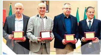
مشاركة قوية لكل الجمعيات النشطة في المجال الخيري، حيث تم تكريم أكثر من 130 جمعية