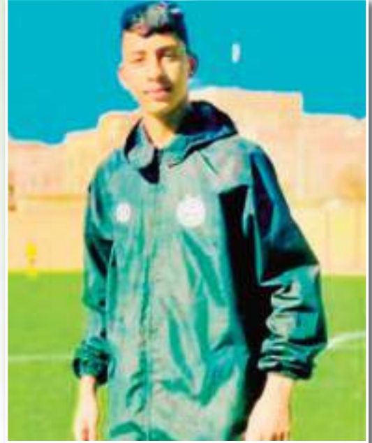
ذيب ع يعتبر واحدا من أبناء ولاية الجلظة الذين جمعوا بين الأخلاق الرفيعة والبراعة الكروية، تربي على احترام الجميع داخل الملاعب وخارجها وعاهد نفسه على أن يكون فردا مهما بكفاءته وحيويته

وأقاهه. خطف الأضواء لسنوات مع أكاديمية فوتبول الجلظة في المسابقات الودية والرسمية المتنوعة، ونال إعجاب وتقدير الكثير من متبعي الشأن الكروي المحلي نظير مستواه اللافت وتأثيره الكبير في نجاحات أبناء عاصمة الولاية. فما كان يفعله بالخصوم جعل أهل الاختصاص يتوقعون تحليقه عاليا في أجواء المستوى المرموق في أقرب الأجل. ورغم موهبته التي سطعت مبكرا ورتبها بالتفاني والانضباط والتتويج بالعديد من الجوائز والتشريفات مع كل الأصناف، إلا أنه