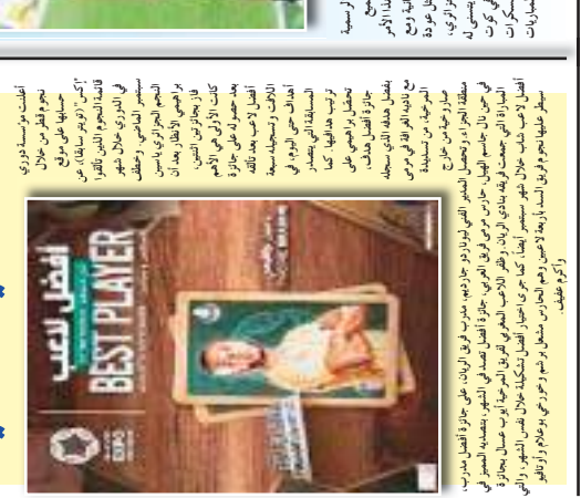
أفضل هداف في دوري قطر موسم 2023-2024