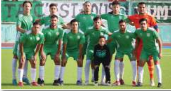
قد يبرمج لقاء تطبيقي مساء اليوم