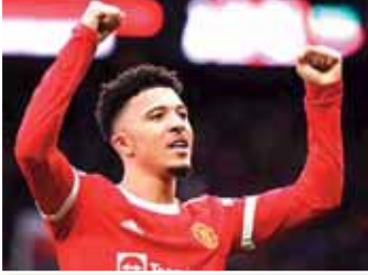
يستعد نادي مانشستر يونايتد للاعبه جادون سانشو، بالرحيل مجاناً عن أولد ترافورد، من أجل تقليل خسائره التي بلغت قيمتها 73 مليون جنيه إسترليني.