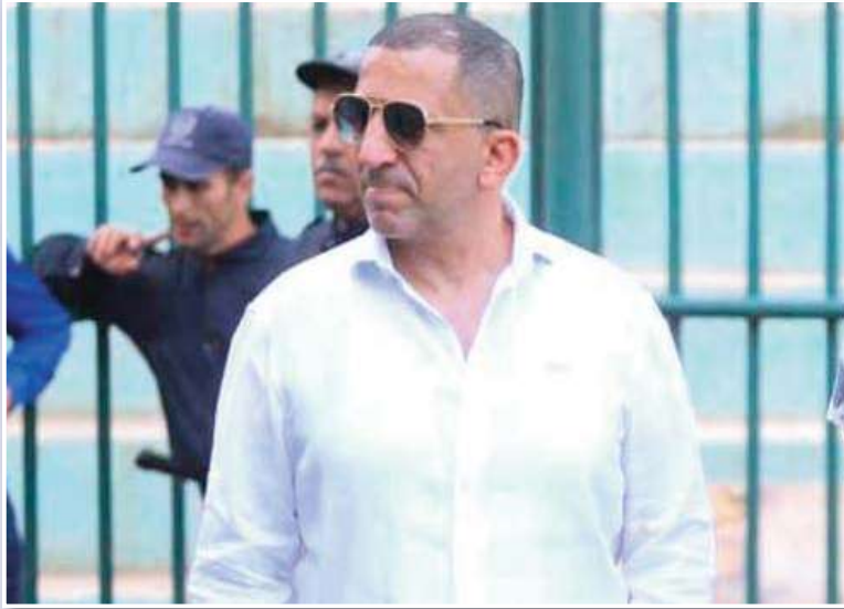
متوفر في الغالبية العظمى منهم.

بفعل قانون تجديد المستوى الدراسي من أجل ترويض أي جمعية رياضية، فإن الباب أصبح مفتوحا الآن أمام الكفاءات وأصحاب الشهادات من أجل الترشح لهذه المناصب، كما أن الأعضاء الحاليين في الجمعية العامة لجمعية وهران ممن يملكون مستوى دراسي لا بأس به لن يجدوا الطريق مقطوعا أمامهم للوصول إلى رئاسة النادي الهواي خلافا لما كان عليه الأمر سابقا، لذا فنحن على موعد بداية من السنة المقبلة على تغييرات في أعلى الهرم الإداري للنادي الهواي لجمعية وهران، وحتى ربما على التكبسة الحالية للأعضاء المكونين للجمعية العامة.