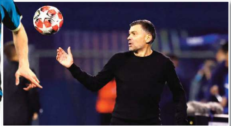
أطلق المدرب البرتغالي سرجيو كونسيساو، مُدرب إيه سي ميلان، تصريحاً غاضباً بعد خسارة فريقه أمام أتالانتا بنتيجة 0-1 في الدوري الإيطالي.