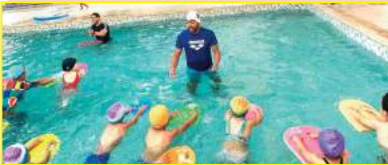
الرياضة الفنية مستقبلا من بوابة التكوين الجيد للفئات الشبانية.