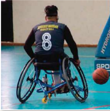
تغطية: و داد هاشم

احتضنت قاعة "لوف" أطوار المرحلة الأخيرة للبطولة الوطنية لكرة السلة على الكراسي المتحركة للقسم الثاني، التي تدخل في إطار الموسم الرياضي 2023/2022. وأشرف على هذه المنافسة الاتحادية الجزائرية لذوي الهمم، وكذا رابطة وهران الولائية لذوي الهمم وهذا بحضور سبع أندية من مختلف ولايات الوطن على غرار أولاد موسى بومرداس، عين تموشنت، أسود وهران، أفاق سعيدة، الساورة، خميس الخشنة. هذه الأندية شاركت في هذه المنافسة من أجل هدف واحد وهو الفوز من أجل المشاركة في منافسة "البلاي أوف" على أمل تحقيق الصعود للقسم الوطني الأول.