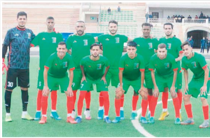
محمد علي الجانب النفسي للاعبيه، قصد رفع معنوياتهم وتحضيرهم للمواعيد القادمة، حيث يركز كثيرا على هذا الجانب خلال هذه الفترة، بالنظر لما خلفته الخسارة أمام وفاق سور الغزلان من آثار في

نفسية اللاعبين الذين تدرّبوا بمعنويات محبطة والتفكير في المباريات القادمة. وقد أكد لهم أن المباراة القادمة أمام شباب وادي رهيو أهم من التفكير في الانهزام السابق أمام الوفاق سور غزلان.