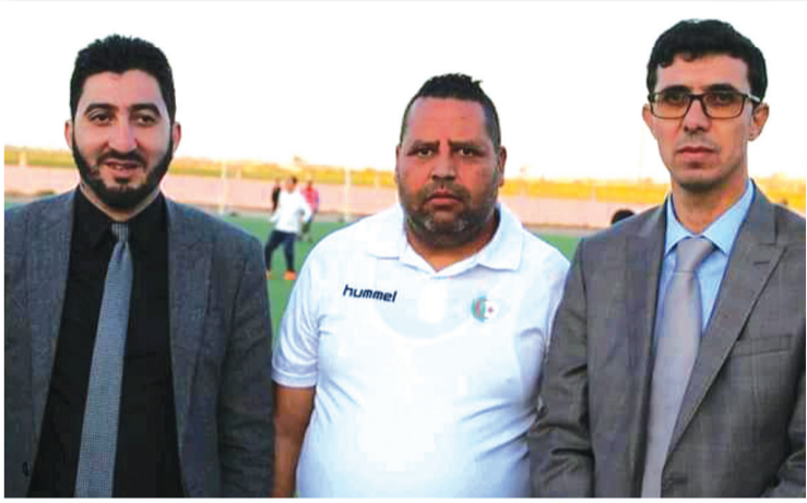
زيارة اللجنة البرلمانية للشباب والرياضة ، و مدير الشباب والرياضة لولاية معسكر السيد