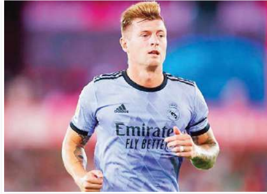
أريد الرحيل. لم يحدث ذلك أبداً، ولم يشك أحد في النادي أبداً في جودتي

صرح الإسباني المحترف توني كروس نجم ريال مدريد الإسباني السابق أنه لم تكن هناك خطة فكر فيها بالرحيل عن المريخي، مشيراً إلى أنه يحب هذا النادي كثيراً، وقرر كروس اعتزال كرة القدم نهائياً عقب انتهاء عقده في الموسم الماضي بعد مسيرة رائعة دامت عشر سنوات مع المريخي. وتحدث كروس بحسب صحيفة "ماركا" الإسبانية قائلاً: "أصبحت شيء كان إخبار أنشيلوتي وابني باني سأعتزل. لقد كان الأمر معقداً".