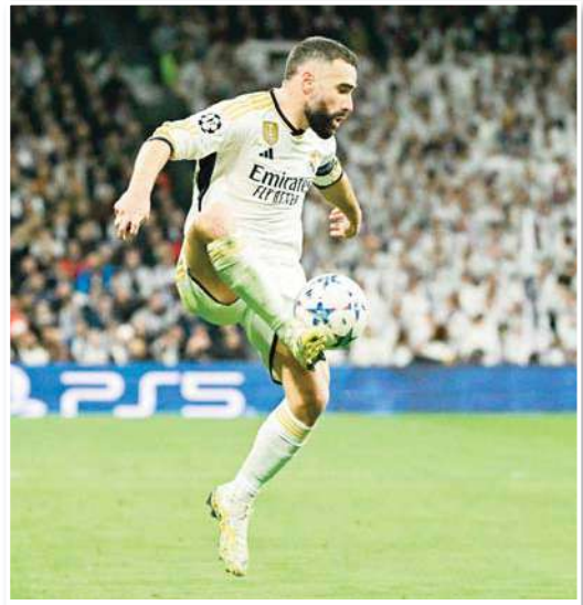
كشفت تقرير صحفي إسباني، عن موازرة داني كارفاخال الظهير الأيمن لريال مدريد، لفريقه، رغم إصابته وانتهاء موسمه، وتعرض كارفاخال لإصابة قوية، بمنزق في الرباط

الصليبي الأمامي للركبة، بالإضافة إلى تحرق في الرباط الجانبي الخارجي للركبة، وتحرق في وتر العضلة الأمامية بساقه اليمنى. وبحسب صحيفة "ماركا" الإسبانية، فإن كارفاخال زار زملاءه في الفريق وتمنى لهم التوفيق قبل مباراتهم ضد بوروسيا دورتموند في دوري الأبطال. وأشارت الصحيفة، إلى أن كارفاخال رغم إصابته سيبقي بجانب الفريق لدعم اللاعبين، ويعرف أنشيلوتي جيداً قيمة كارفاخال، حيث يتمتع بالقوة العقلية، ويؤكد المدرب أهمية دوره القيادي في الفريق. ووفقاً لأنشيلوتي، فالفريق لم يخسر فقط أفضل ظهير أيمن في العالم في المباريات، بل فقد أيضاً لاعبا تنافسيا يحفز زملاءه في كل قرين