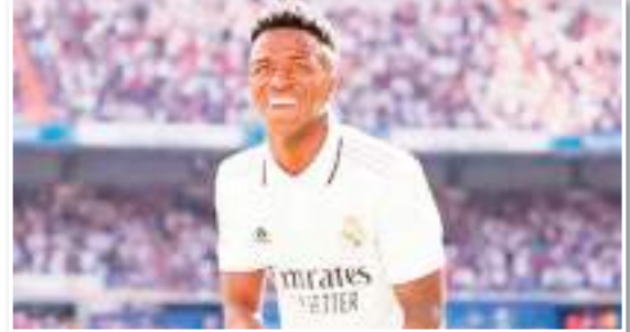
بات البرازيلي فينيسوس جونور، نجم ريال مدريد، مهدداً بالإيقاف لفترة طويلة في الدوري الإسباني بسبب سوء سلوكه. ووفقاً لصحيفة "مونديو ديورتيغو" الإسبانية، اعتدى فينيسوس

جونور على أحد لاعبي المرييا، خلال مباراتهما الأخيرة، ضمن منافسات الجولة 21 من الليغا. وأشارت الصحيفة إلى أن الفيديو الخاص بالاعتداء لم يظهر في كاميرات البث الرئيسية أو الكاميرات الخاصة بتقنية الفيديو. وأوضحت أن هذه الواقعة حدثت عندما كانت نتيجة المباراة ما تزال التعادل 2-2. وذكرت أن هذا الفعل قد يكلف فينيسوس عقوبة مغلظة، إذا تقدم نادي المرييا بشكوى وفقاً للاتحة. وفي هذه الحالة، فإن الاتحاد الإسباني سيفتح تحقيقاً استثنائياً لتحليل الواقعة، وإذا اعتبر تصرف فينيسوس اعتداءً، فإنه سيتعرض للإيقاف لمدة 4 مباريات على الأقل، وقد تصل العقوبة إلى 12 مباراة وفقاً للوائح. ويحتل ريال مدريد وصافة اللجا برصيد 51 نقطة، فيما يأتي بتدليل المرييا الترتيب ب6 نقاط.