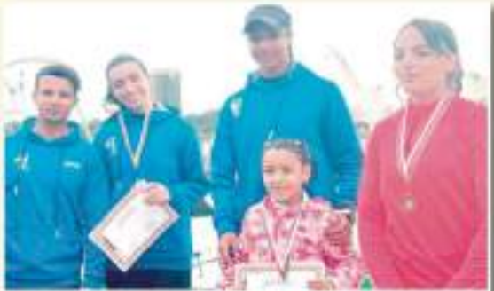
أطفال صرايبي (جدافة نادي خديم مصطفى)،