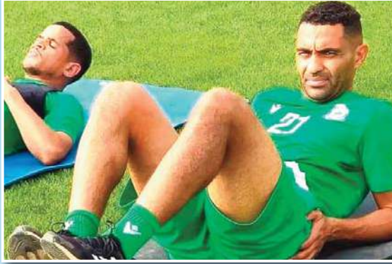
هذا ومن المنتظر أن يجري الفرسان حصص متنوعة بين الجانب البدني والفني وذلك

حتى يتمكن قبل الخميس من الوقوف على مدى جاهزية اللاعبين، خاصة وأن رفاقه القائد قوار بذلوا مجهودات كبيرة في لقاء بسكرة الذي كان فرق ارضية ثقيلة وكارثية، على أن يكون العمل عادي بداية من الغد لنادي الإرهاق خاصة وأن موعد هام ينتظرهم في هذا الأسبوع، وفي نفس السياق فإن تشكيلة المولودية تعول كثيرا على الفوز داخل الديار لتعويض ما فاتهم في الشطر الأول من البطولة، هذا وأبدى عمروش وإرتياحه للأجواء في المجموعة خاصة وأن الإزادة موجودة فقط على اللاعبين تطبيق التعليمات للوصول لكامل جاهزيتهم التامة.