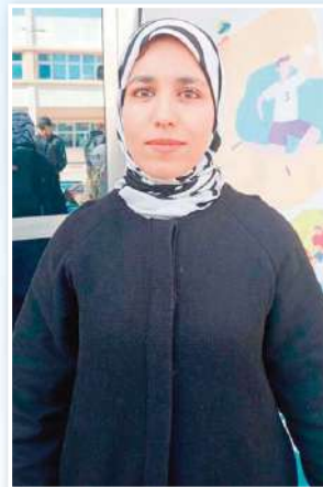
المستوى الثالث فهو للنخبة الذين يمثلون الجزائر في المحافل الدولية.

«نحن نحرص على توفير بيئة مناسبة لممارسة مختلف الرياضات، سواء الفردية أو الجماعية، كما نهتم بالنشاطات الثقافية والعلمية. كل هذا بدعم من إدارة المدرسة، وعلى رأسها السيدة المديرية، التي تشجع دائما على تنظيم مثل هذه الفعاليات لضمان نجاح الطلبة في مسارهم الأكاديمي والرياضي.»