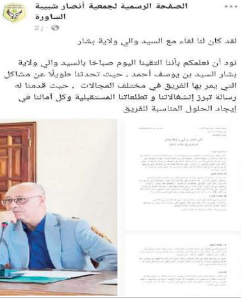
الصفحة الرسمية لجمعية أنصار شبيبة الساورة. لقد كان لنا لقاء مع السيد والي ولاية بشار نود أن نعلمكم بأننا التقينا اليوم صباحا بالسيد والي ولاية بشار السيد بن يوسف أحمد ، حيث تحدثنا طويلا عن مشاكل التي يمر بها الفريق في مختلف المجالات ، حيث قدمنا له رسالة تبرز إشغالاتنا و تطلعاتنا المستقبلية وكل آمالنا في إيجاد الحلول المناسبة للفريق.

بحسب لائحة المطالب التي رفعتها جمعية أنصار شبيبة الساورة للرجل الأول في ولاية بشار، الوالي أحمد بن يوسف ، فإن ثالث إشغال تم طرحه هو متعلق بنظافة ملعب 20 أوت بشار، ومحيطه، حيث أكدت ممثلوا الأنصار، الوضع الكارثي لنظافة في