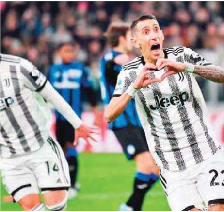
قضت أعلى محكمة إيطالية اليوم الخميس بتعليق عقوبة خصم يوفنتوس 15 نقطة من على خلفية نشاط مالي غير مشروع، مشيرة إلى ضرورة إعادة النظر في القضية. بهذا القرار، يعود عملاق

تورينو إلى المركز الثالث في جدول ترتيب الدوري مع 59 نقطة، لكن يتعين عليه انتظار حكم جديد من المحكمة التابعة للاتحاد الإيطالي لكرة القدم والتي فرضت العقوبة الأصلية. وقبل إعادة النقاط إلى يوفنتوس، كان الفريق يواجه شيخ الغياب عن البطولات الأوروبية خلال الموسم المقبل في ظل ابتعاده عن مراكز المقدمة في الدوري الإيطالي. لكنه كان يملك فرصة أخرى للوجود في دوري الأبطال عبر التوقيع بقلب الدوري الأوروبي، إذ فاز في ذهاب الدور ربع النهائي على ضيفه سبورتنغ لشبونة البرتغالي 1-0، ويلتقي معه مساء اليوم الخميس في مباراة الإياب. وكانت محكمة الاستئناف التابعة للاتحاد الإيطالي للعبة خصمت يوم 20 يناير الماضي 15 نقطة من رصيد يوفنتوس لتسجيله - حسب العدالة الرياضية- مكاسب رأسمالية فيبالغ فيها بشكل منظم في حساباته عند بيع بعض اللاعبين. وأعلن النادي الملقب بـ"السيدة العجوز" الطعن في القرار أمام لجنة التحكيم التابعة للجنة الأولمبية الإيطالية لإلغاء هذه العقوبة. وطلب مجلس الضمان الرياضي التابع للجنة الأولمبية الإيطالية في بيان من المحكمة التابعة للاتحاد مراجعة العقوبات المفروضة على النادي وبعض الشخصيات الرئيسية، بما في ذلك الشيكيني بابيل نيدفيد نائب رئيس مجلس الإدارة السابق والذي طالته عقوبات بموجب الحكم الأصلي. وألقي على الحظر الطويل المفروض على رئيس مجلس الإدارة السابق أندريا أنيلي، والرئيس التنفيذي السابق مارتينو أورفابيني، والمديرين الرياضيين فيديريكو تشيرويني وفابيو بارانسي. واستقال أنيلي من منصب رئيس يوفنتوس، واستقال أيضا باقي أعضاء مجلس إدارة النادي وأواخر نوفمبر الماضي قبل أيام من طلب المدعين إجراء المحكمة.