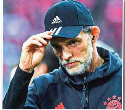
منحت إدارة بايرن ميونخ حصانة غير مشروطة هذا الموسم للألماني توماس توخيل، المدير الفني للفريق البافاري. وكتب فابريزيو رومانو، خبير الانتقالات

الملاعبين والمدربين في أوروبا، على حساب ب "تويتز" لن يغير بايرن موقفه من استمرار توماس توخيل مهما حدث للفريق في الدوري الألماني". وأضاف: "ستخطط إدارة بايرن ميونخ مع توخيل لفترة الانتقالات الصيفية المقبلة، من أجل إعادة بدء المشروع في الموسم المقبل". واختم خبير الانتقالات: "أولوية بايرن ميونخ في الميركاتو الصيفي ستكون التعاقد مع مهاجم جديد". يذكر أن بايرن ميونخ فشل في تحقيق الفوز للمباراة الرابعة على التوالي، لأول مرة منذ أكتوبر 2018. جاء ذلك بعد الخسارة أمام مان سيتي (0-3) في الذهاب، قبل التعادل مع هوفهايم (1-1)، وكذلك أمام السبتي في الإياب بالنتيجة نفسها، فيما انتهت المباراة الرابعة بالهزيمة أمام ماينز. وشهد توخيل 3 هزائم مع بايرن منذ توليه قيادة الفريق، ليساوي عدد الخسائر التي تلقاها الفريق في عهد يولييان ناغلسمان على مدار الموسم.