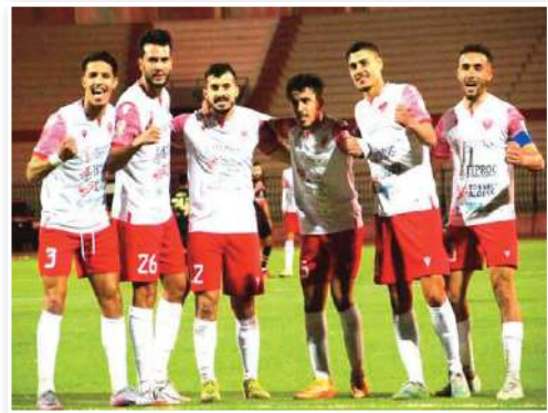
انتعشت خزينة النادي الهاوي لمولودية وهران خلال الأيام القليلة المقبلة بإعانة مالية مهمة بقيمة ستة ملايين سنتيم مخصصة من ميزانية الولاية، وهي الإعانة التي