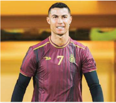
وجه النجم البرتغالي كريستيانو رونالدو قائد فريق النصر السعودي تهنته إلى المسلمين عامة وجماهير "العالمي" بمناسبة حلول عيد الفطر المبارك. وتخطى والذي نشره

"النصر" على كافة حساباته وصفحاته على مواقع التواصل الاجتماعي - المليون مشاهدة خلال ساعات من بثه. وخلال دخوله رفقة زملائه إلى التدريبات، قال "صاروخ ماديرا" باللغة العربية "عيد مبارك". ويتحضر النصر لمواجهة فريق الوحدة اليوم ضمن منافسات الدور نصف النهائي من مسابقة كأس خادم الحرمين الشريفين. وبعد انتهاء التدريبات غرد رونالدو (38 عاماً) على حسابه الرسمي في تويتر "التركيخ في التحضيرات لنصف النهائي، عيد مبارك لكل من يحتفلون" وأرفق تغريدته بصور له من التدريبات.