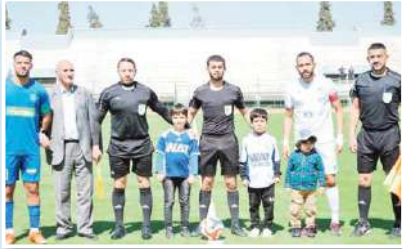
تفادي الهزيمة بعد لقاءات شبيهة الأمير عبد

ودعم عناصر التشكيلة في مباراتها التي كانت جد صعبة. وبعد كذلك الفوز المحقق للوداد أمام شباب الحناية نقطة تحول جد مهمة للفريق، إذ أن نقاط هذه المواجهة قد مكنت «أبناء الزرقة» من الحفاظ على المركز الثالث ورفع رصيدهم إلى 48 نقطة بفارق 6 نقاط عن رائد بذلك المنافسة وبكل شراسة على تحقيق ورقة الصعود إلى جانب الوصيف مولودية سعيدة.