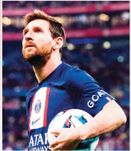
خفت فريق ليونيل ميسي في الأشهر الأخيرة، رغم الجوائز الفردية التي يحصدتها بين حين وآخر، استمرارا لمكافئته على الترويج مع منتخب الأرجنتين بلقب كأس العالم في جويلية ديسمبر 2022. وبعد أشهر قليلة من الموندنال، قرر ميسي الابتعاد عن الصراعات والضغط في الملاعب الأوروبية، لخوض رحلة جديدة بعيدا عن الأضواء، في جويلية

قبل وصول ميسي، كان سان جيرمان يقترّب أكثر من اللقب الذي طال انتظاره، في دوري أبطال أوروبا. هذا بعد وصول الفريق لنصف النهائي في موسمين متتاليين، شهد الأول (2019-2020) بلوغه المباراة النهائية قبل الخسارة على يد بايرن ميونخ. وتجدد الحلم في العام التالي مباشرة بالوصول مرة أخرى للمربع الذهبي قبل أن يتبدد على يد مانشستر سيتي. التعاقب مع ميسي في صيف 2021، جعل الجماهير الباريسية تطمح أكثر في اللقب الأوروبي، بعدما أصبح الفريق يمتلك مثلنا هجوميا ناريا، متمتلا في نيمار، كيليان مبابي وأسطورة الأرجنتين.