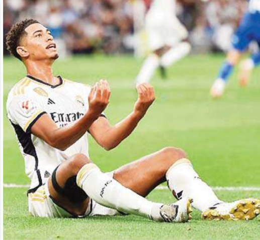
لست مثالياً، ولكني أريد أن أكون قدوة للشباب الصغير". ولعب بيلينغهام مع ريال مدريد في 36 مباراة في كافة المسابقات، سجل 21 هدفاً، وصنع 10 أهداف.

أدى جود بيلينغهام، لاعب ريال مدريد، سعادته بالفصول على جائزة لوريوس العالمية لأفضل موهبة صاعدة في عام 2024. ويأتي تكريم بيلينغهام بعد المستويات الرائعة التي يُقدمها هذا الموسم مع ريال مدريد في كافة المسابقات. وكان بيلينغهام قد ساهم بشكل فعال في فوز فريقه بالأش على برشلونة في كلاسيكو الدوري الإسباني.