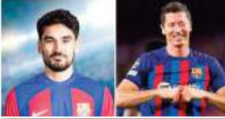
لعب البولندي روبرت ليفاندوفسكي، مهاجم فريق برشلونة

الإسباني، دوراً في انتقال الألماني إلكاي غوندوغان، متوسط ميدان فريق مانشستر سيتي الإنجليزي، إلى البارسا في الصيف الحالي. وحسم برشلونة صفقة التعاقد مع جوندوغان بعقد مدته موسمين مع خيار التجديد لموسم ثالث، لكن الصفقة لم يعلن عنها بشكل رسمي حتى الآن، حيث فضل الألماني الانتظار لوداع زملائه في السيتي قبل الإعلان الرسمي.