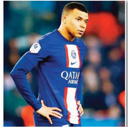
يحتفظ نادي باريس سان جيرمان بحجة بعقد أنها ستقوى موقفه في الصراع مع المهاجم الفرنسي كيليان مباي، المنضم حديثا إلى ريال مدريد، بشأن المستحقات. وكان مباي

اشتكى باريس، وطالبه بدفع رواتب متأخرة ومكافآت بإجمالي 100 مليون يورو. ووفقا لصحيفة "ماركا" الإسبانية، يعتقد باريس أن لديه وعد من مباي بعدم الرحيل مجانا عن سان جيرمان، ويعتمد على ذلك في قرار حرمانه من الرواتب والمكافآت. ويرى باريس أنه يستطيع أن يستشهد على وعد مباي بشهادات الحاضرين في الاجتماع المزعوم الذي أعطى فيه كيليان كلمته بأنه لن يغادر مجاناً. وأشارت إلى أن بين هؤلاء الشهود قد يكون المستشار الرياضي لويس كامبوس والمدير الفني لويس إنريكي نفسه، إضافة إلى بعض موظفي النادي. ويعتمد باريس أيضا على التصريح الذي أطلقه مباي علنا، عندما قال: "أنا متحمس جدا لهذا الموسم... لدينا العديد من الألقاب للمنافسة عليها.. لم اتخذ قرارا بعد، لم أختبر بعد، ولكن على أي حال، وفقا للاتفاق الذي توصلت إليه مع الرئيس في الصيف، لا يهم قراري لأننا نجتهد في حماية الطرفين وضمان الهدوء في النادي للتركيز على التحديات القادمة، وبالتالي الباقي هو أمر ثانوي". وأكدت "ماركا" أنه ليس واضحا حتى الآن إذا كان الوعد الذي يتحدث عنه باريس يمكن أن يكون حجة كافية أمام المحاكم لإدانة مباي أم لا.