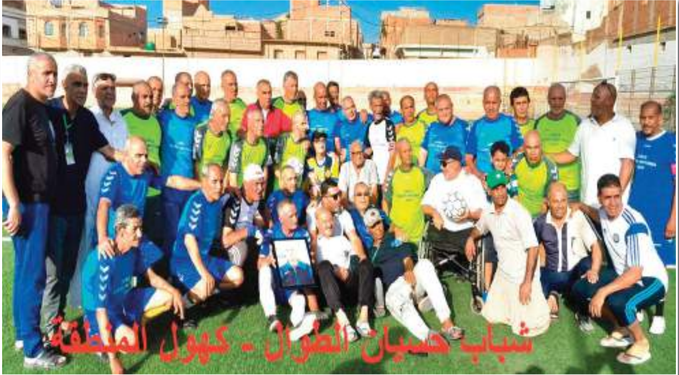
شباب حسيان الطوال - كهول المنطقة