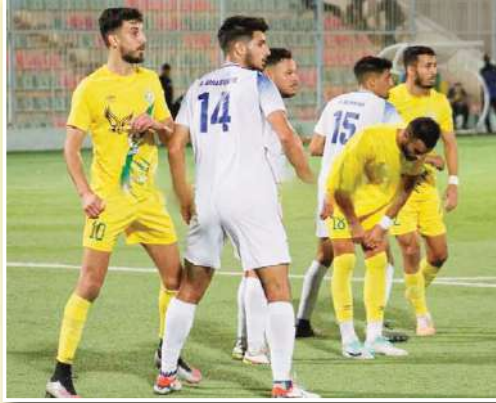
الديار، وبعد تبادل في نتائج الفريق منذ إنصار واحدا في خمسة لقاءات كاملة في البطولة، كان أمام وفاق سطيف في بداية الموسم، حيث لم يحقق الفريق سوى