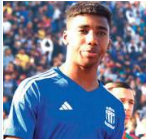
أعتبر من له علاقة بنادي الإتحاد الرياضي المنجي من قبل الساهرين على تسيير شؤون السوي أن استدعاء اللاعب باسو عبد العارضة الفنية للألوان الوطنية ومشاركته مع

لا زالت قضية عدم تأهيل مجموعة اللاعبين المعول عليهم للنهوض بالفرق وإبعاده عن