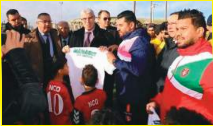
يوصل التألق بفضل العمل الجاد الذي يقوم به الطاقم الفني والإداري. الفئات (9U، 11U، 13U، 14U) حققت انتصارات متتالية تعكس جودة التكوين الذي يميز النادي.