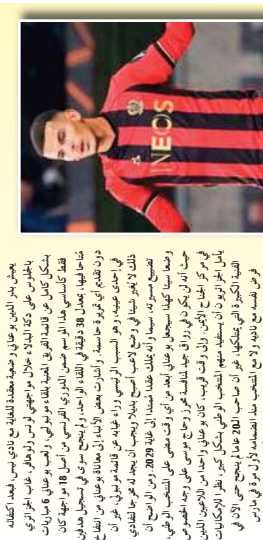
بعض خبر النيس، بوعناني، وصحة جيدة للغاية بعد إصابته بمرض عضال، على رأسه، جراحات في القدم، بعد أن وافق على انتقاله من فريقه السابق، المثلثي، بـ 10 ملايين جنيه إسترليني.