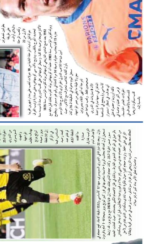
سجل حارس النجم الجزائري، حجمام، هدفا، بعد أن وافق على انتقاله من فريقه السابق، المثلثي، بـ 10 ملايين جنيه إسترليني.