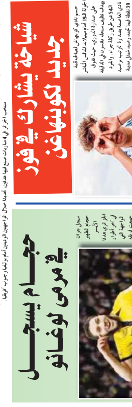
حسم نادي كويناهاغن، فوزا كبيرا، على نادي ليدز يونايتد، بعد أن وافق على انتقاله من فريقه السابق، المثلثي، بـ 10 ملايين جنيه إسترليني.