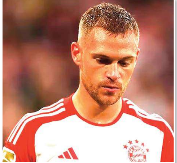
رفض ريال مدريد، فرصة التعاقد مع نجم بايرن ميونخ، الذي نجح الكثير من الشكوك حول مستقبله مع العملاق البافاري. وينتهي عقد جوشوا كيميشت مع بايرن ميونخ الصيف المقبل، ولا يزال لم يحسم مستقبله بعد بتجديده

تعاقد مع العملاق البافاري أم الرحيل. وبحسب صحيفة «ماركا» الإسبانية، تم عرض كيميشت على ريال مدريد، إلا أن النادي الإسباني رفض الصفقة. يأتي ذلك في الوقت الذي نجح فيه بايرن ميونخ في تجديد عقود العديد من نجوم الفريق في الأونة الأخيرة، مثل: مانويل نوير، وجمال موسيلا، إضافة إلى ألفونسو ديفيز. وبعد كيميشت من أبرز الأسماء تحت قيادة كومانبي هذا الموسم، حيث شارك في 35 مباراة في جميع المسابقات ونجح خلالها في تسجيل هدف واحد وصناعة 10 آخرين. رفض ريال مدريد، فرصة التعاقد مع نجم بايرن ميونخ، الذي نجح الكثير من الشكوك حول مستقبله مع العملاق البافاري. وينتهي عقد جوشوا كيميشت مع بايرن ميونخ الصيف المقبل، ولا يزال لم يحسم مستقبله بعد بتجديده تعاقد مع العملاق البافاري أم الرحيل. وبحسب صحيفة «ماركا» الإسبانية، تم عرض كيميشت على ريال مدريد، إلا أن النادي الإسباني رفض الصفقة. يأتي ذلك في الوقت الذي نجح فيه بايرن ميونخ في تجديد عقود العديد من نجوم الفريق في الأونة الأخيرة، مثل: مانويل نوير، وجمال موسيلا، إضافة إلى ألفونسو ديفيز. وبعد كيميشت من أبرز الأسماء تحت قيادة كومانبي هذا الموسم، حيث شارك في 35 مباراة في جميع المسابقات ونجح خلالها في تسجيل هدف واحد وصناعة 10 آخرين.