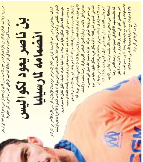
كشفت وسائل إعلام فرنسية، عودة بن ناصر من نادي كواليا، بعد أن وافق على انتقاله من فريقه السابق، المثلثي، بـ 10 ملايين جنيه إسترليني.