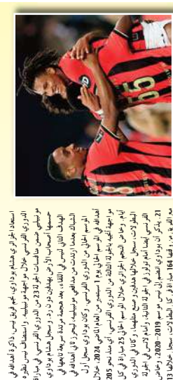
استطاع الحارس الجزائري، بسجوداوي، إقناع نادي نيوكاسل الإنجليزي، بضمه في صفوفه، بعد أن وافق على انتقاله من فريقه السابق، المثلثي، بـ 10 ملايين جنيه إسترليني.