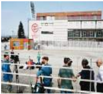
يقع مدرب منتخب إسبانيا لويس دي لا فويتسي في أن فريقه مسؤول عن تحسين صورة كرة القدم الإسبانية من خلال أدائه في الملعب مع خضوع الاتحاد اغلي للعبة لتحقيق في قضية فساد. وأقال الاتحاد الإسباني الخميس اثنين من مسؤوليه بعد أن داهمت

الشرطة مقرات الاتحاد في العاصمة مدريد. وقال الاتحاد إن المسؤولين كانا على صلة بتحقيقات فساد تتضمن عدة ملايين، وأضاف أن القضية سببت "ضررا بالغا للغاية" لصورة الرياضة في البلاد. وداهمت الشرطة شقة تخصص رئيس الاتحاد السابق لويس روبيالس في إطار تحقيق في مزاعم فساد. وقال مدرب إسبانيا للصحفيين الخميس عندما سُئل عن مدهامات الشرطة "لا أحد يتوقع ذلك، الأمر ليس جيدا، هناك شعور بالخزن فيما يتعلق بالصورة التي تقدمها. لا يجب أن يؤثر ذلك على عملنا لكننا لا نعيش منفصلين عن الواقع. نحن نريد من السلطات أن تحقق وتحدد مسؤولياتنا". وأضاف "الدينا مسؤولية هائلة، نريد جلب أخبار جيدة للجماهير ولبلداننا ولذلك نتحاج للتركيز والعمل ولعب مباريات جيدة وتقديم صورة جيدة لإسبانيا والاتحاد الإسباني". وتلعب إسبانيا ضد كولومبيا اليوم الجمعة في لندن، ثم تلقي مع البرازيل يوم الثلاثاء المقبل في مباراتين وديتين. واضطرت كرة القدم الإسبانية للتعامل مع عدد من القضايا خارج الملعب مؤخرا بعد أن أوقفت لجنة الاستئناف بالاتحاد الدولي لكرة القدم (فيفا) روبيالس 3 سنوات بسبب مزاعم عن تقبيله للاعبة جيني إيرموسو على شفحتها دون موافقتها بعد فوز إسبانيا على إنجلترا في نهائي كأس العالم للسيدات العام الماضي.