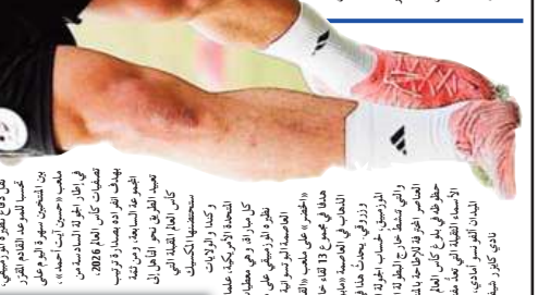
الهدف من منتخب موزمبيق الامر الذي يبرز أهمية المنتخب الجزائري في هذه التصفيات الأوروبية المؤهلة لكأس العالم 2026. وذلك بهدف زرع الثقة في أجنحة المنتخب الوطني من خلال المشاركة في كأس العالم 2026.