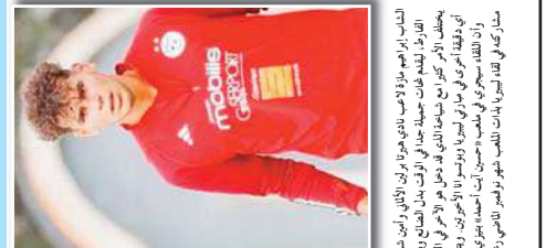
الهدف من منتخب موزمبيق الامر الذي يبرز أهمية المنتخب الجزائري في هذه التصفيات الأوروبية المؤهلة لكأس العالم 2026. وذلك بهدف زرع الثقة في أجنحة المنتخب الوطني من خلال المشاركة في كأس العالم 2026.