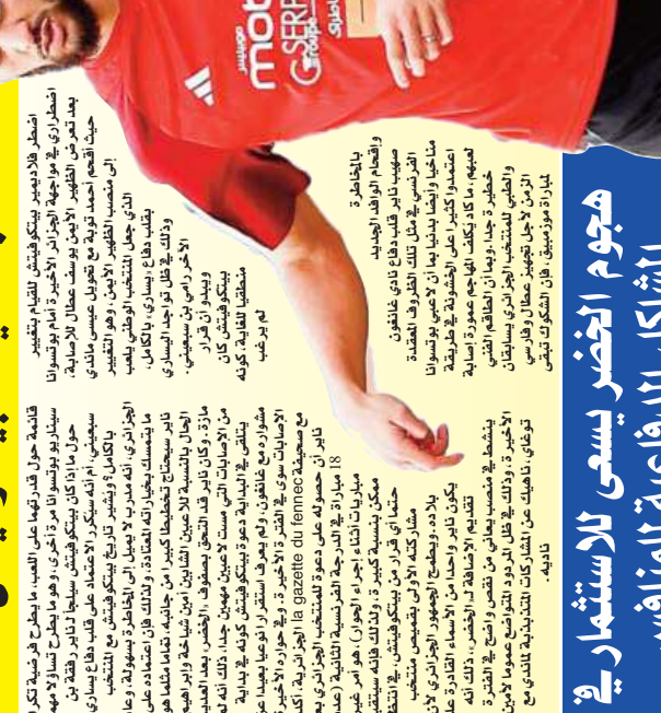
الهدف من منتخب موزمبيق الامر الذي يبرز أهمية المنتخب الجزائري في هذه التصفيات الأوروبية المؤهلة لكأس العالم 2026. وذلك بهدف زرع الثقة في أجنحة المنتخب الوطني من خلال المشاركة في كأس العالم 2026.