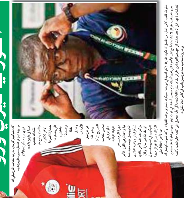
الهدف من منتخب موزمبيق الامر الذي يبرز أهمية المنتخب الجزائري في هذه التصفيات الأوروبية المؤهلة لكأس العالم 2026. وذلك بهدف زرع الثقة في أجنحة المنتخب الوطني من خلال المشاركة في كأس العالم 2026.