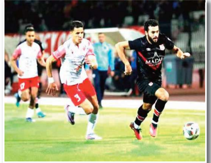
أقدم أعضاء اللجنة المسيرة المؤقتة لمولودية وهران على تسديد منحة الفوز الذي حققته التأخرة أمام شباب بلوزداد، حيث تلقى رفاقه