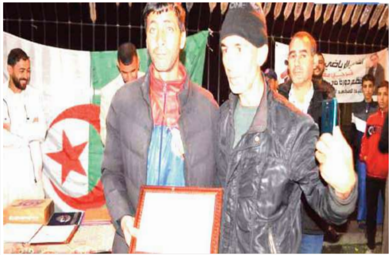
"تحية شكر وتقدير لجريدة بولا"

كما شدد متحدتنا على أهمية تشجيع هذا النوع من التظاهرات الرياضية التي لا يتوجب أن تتوقف فقط، حسب، على شهر الصيام، بل يتعين أن تنظم على مدار أيام السنة للمساهمة في ترقية ممارسة كرة القدم واكتشاف المواهب الشابة الراغبة في تحقيق مشوار مشجع في هذه الرياضة الشعبية وتمكينها كذلك من الحصول