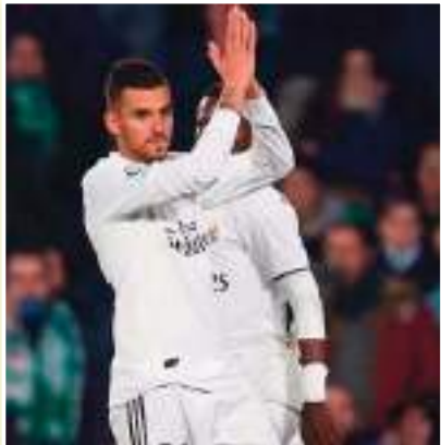
صفوف ريال مدريد صيف 2017 قادماً من ريال بيتيس الإسباني بمبلغ 16.5 مليون يورو.