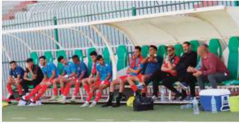
الاتحاد قد يضع أهدافه بسبب الديون

يبدو أن فريق اتحاد سيدي بلعباس مقبل على بداية موسم صعبة للغاية، بسبب كثرة الديون خاصة تلك التي تتعلق بديون الرابطة والتي ستجعل انطلاقته الموسم المقبل صعبة مادام أن سيناريو الإجازات سيكرر حتما هذا الموسم، في ظل الأزمة المالية التي يتخبط فيها الفريق. ناهيك عن القيمة الكبيرة لديون الرابطة، وهو ما سيدخل النادي في نفق مظلم قبل بداية مشوار في بطولة ما بين الجهات للموسم الثاني للإتحاد.